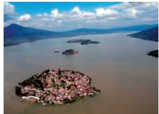
Michoacán cuenta con una gran cantidad de paisajes, como el lago de Pátzcuaro.

El relieve de Michoacán está marcado por dos grandes sierras; es decir, dos grandes conjuntos de montañas: el Sistema Volcánico Transversal y la Sierra Madre del Sur.