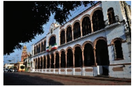
Universidad Autónoma de Sinaloa en Culiacán.

En el año 2000 se graduaron 10 000 universitarios y 48 000 en los 100 centros de capacitación.