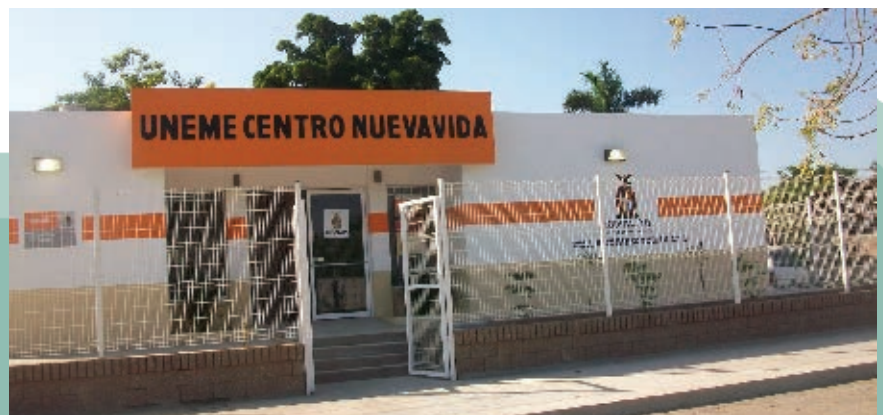
Servicios de salud.

Sinaloa cuenta con grandes hospitales en Culiacán, Mazatlán y Los Mochis, además de numerosas clínicas rurales y urbanas. Las mayores carencias en materia de salud se ubican en las tierras altas, poco a poco se avanza en la solución de este problema.