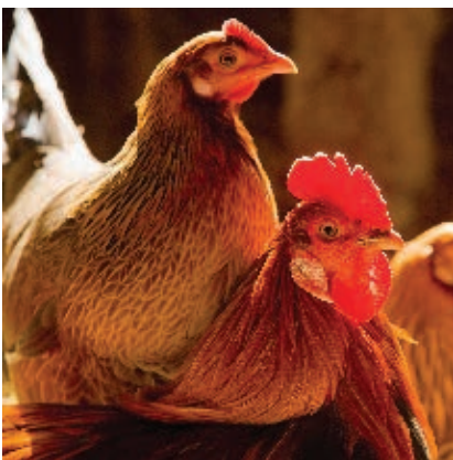
Aves de corral.