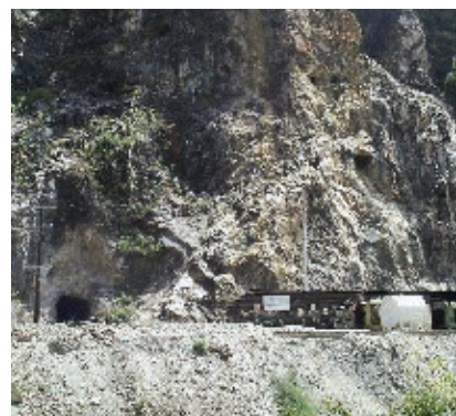
Entrada a la mina de Nuestra Señora de la Candelaria en Cosalá.

Las minas más importantes se localizan en los municipios de San Ignacio, Culiacán, Rosario, Cosalá, Badiraguato, Mazatlán, El Fuerte, Choix, Concordia, Mocorito, Elota, Escuinapa y Sinaloa. Los principales minerales que se extraen en nuestro estado son plata, fierro, zinc, plomo, cobre y oro.