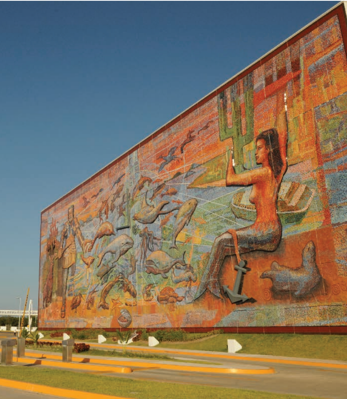
Centro de Convenciones en Mazatlán.