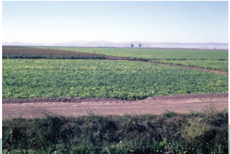
Cultivo de frijol en Los Mochis.

También ocupa el primer lugar en la producción de maíz, el segundo lugar en soya, el tercero en cártamo y trigo, y el cuarto lugar en la de frijol y sorgo.