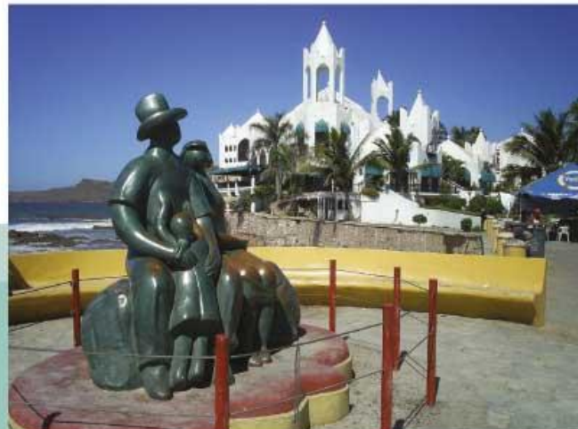
Monumento a la familia en Mazatlán.

Para conocer el escudo de cada uno de los municipios de nuestra entidad consulta: http://siglo.inafed.gob.mx/enciclopedia/EMM25sinaloa/municipios/municipios.html