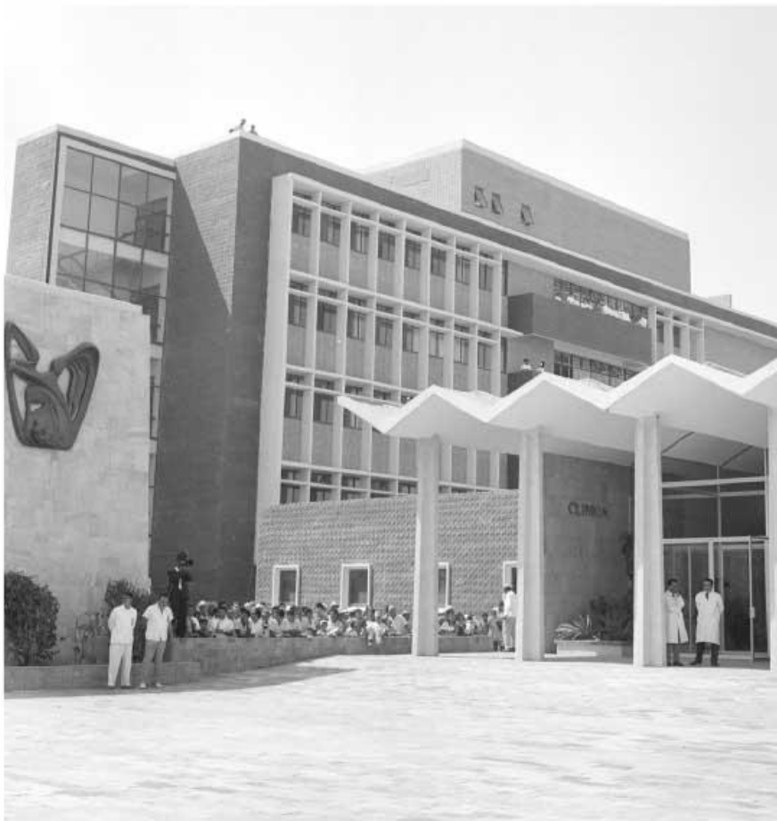
Clínica del Seguro Social en Los Mochis.

Para saber cuántos habitantes hay en tu localidad y en tu municipio consulta: < http://cuentame.inegi.org.mx/monografias/informacion/SinPoblacion/default.aspx?tema=ME&e=25 >