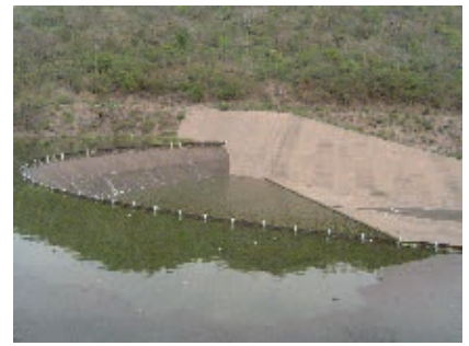
Presa Adolfo López Mateos.