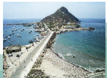
Atracadero en Mazatlán.

El puerto de Mazatlán es el principal destino turístico, nacional e internacional, de nuestro estado; además, recientemente el gobierno federal declaró pueblos mágicos a Cosalá, El Fuerte y El Rosario. Esto permitirá recibir más visitantes, lo que beneficiará a la población local.