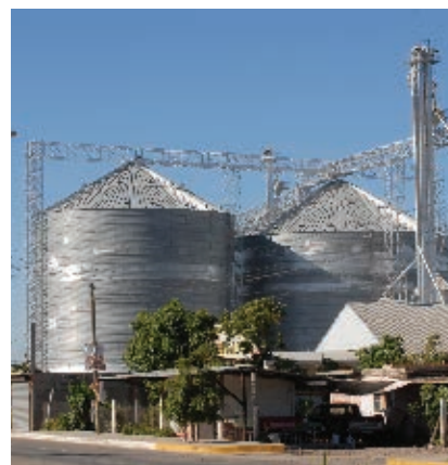
Silos de grano.

La actividad maquiladora se consolida y actualmente se encuentra establecida en los municipios de Ahome, Guasave, Mazatlán y Culiacán. La industria maquiladora se orienta a diversos giros, principalmente la industria automotriz, el procesamiento de pescado, mariscos y la industria textil.