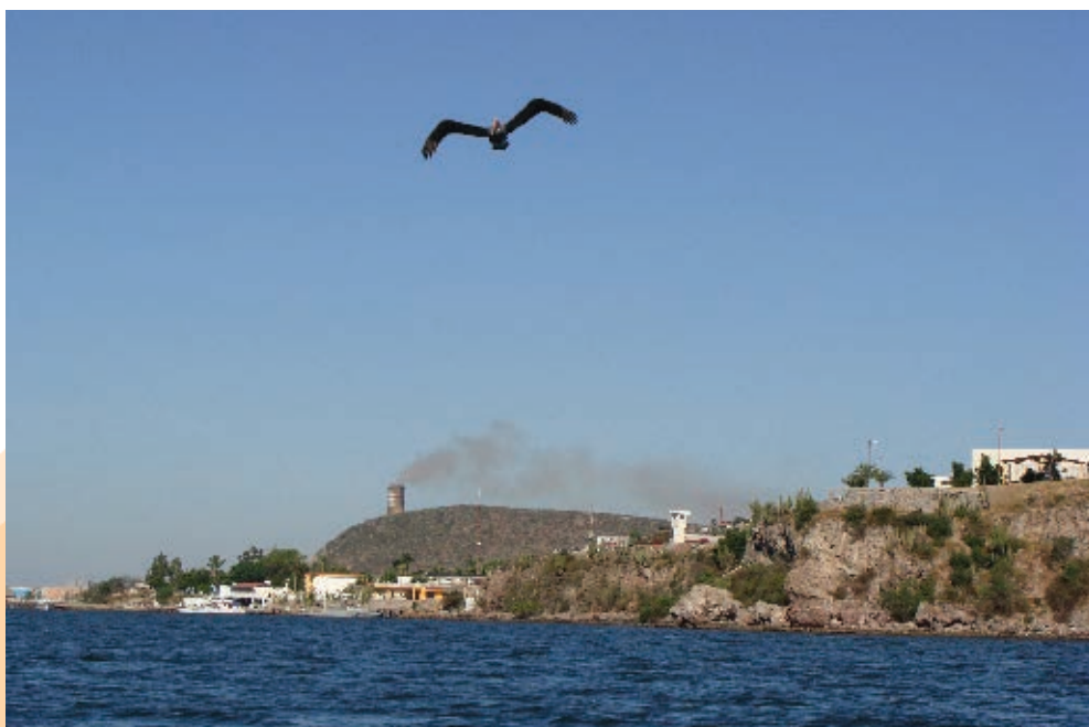
Puerto de Topolobampo.

Los pueblos y ciudades experimentaron un cambio notable, ya que crecieron y sus áreas geográficas de población se extendieron. Sin embargo, ese nivel de desarrollo no fue suficiente porque las condiciones de desigualdad seguían imperando en el país, y el régimen porfirista no las había atendido; por eso, amplios sectores de la población apoyaron el movimiento revolucionario, esperanzados en que cambiara su situación.