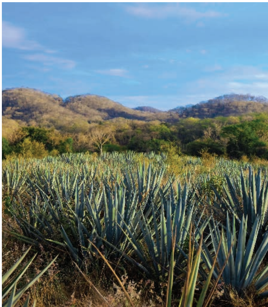
Maguey de mezcal, La Noria, municipio de Mazatlán.