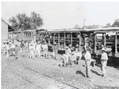
Estación del ferrocarril en Navolato.