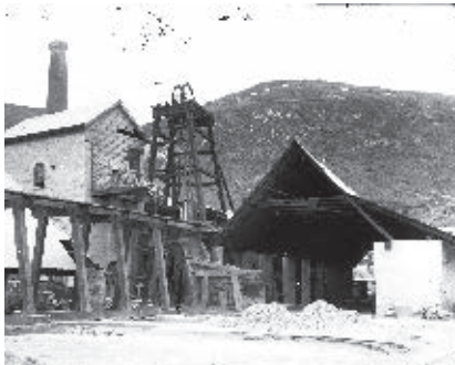
Malacate de la mina de Copala.

En 1884, la minería en Sinaloa estaba controlada por inversionistas extranjeros. La cuarta parte del capital extranjero se concentró en la explotación de cobre, oro, plata, plomo, hierro, antimonio, zinc y mercurio.