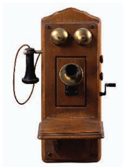
Teléfono del siglo XIX.

Para 1890, también se extendió el servicio telefónico en el estado. La línea telefónica llegó al pueblo de Pericos, a una distancia de 42 kilómetros de Culiacán. Para entonces (1900), este lugar ya había quedado comunicado con el puerto de Topolobampo y en 1901, la red había conectado el territorio de Choix con el pueblo de Aguacaliente de Baca. La línea tenía entonces una longitud de 80 kilómetros a partir de la ciudad de El Fuerte.