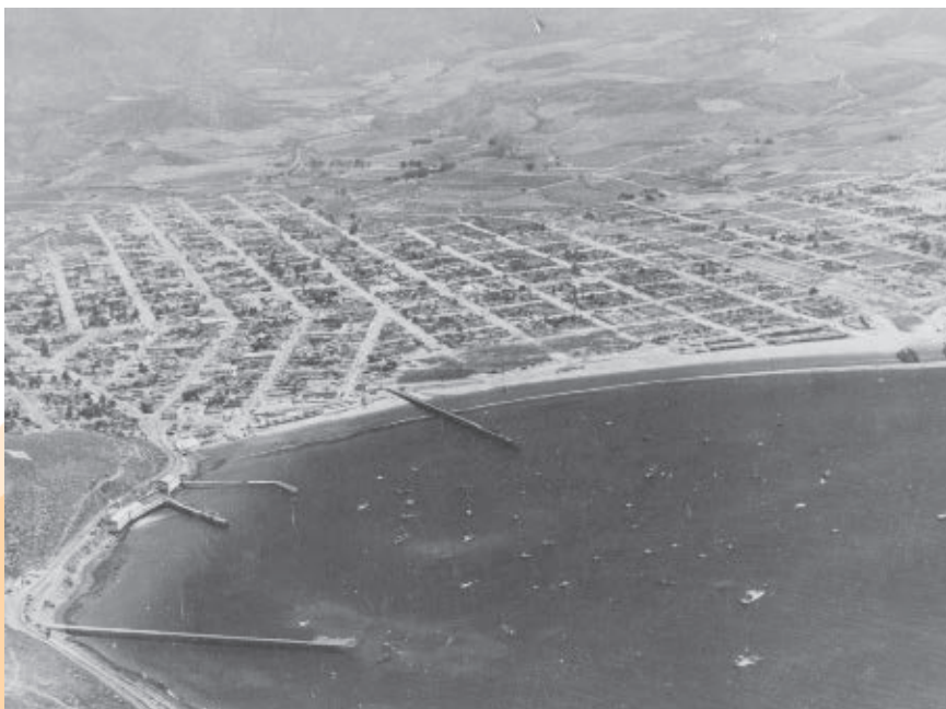
Vista panorámica de Topolobampo.