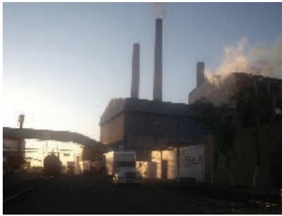
Ingenio de Navolato.