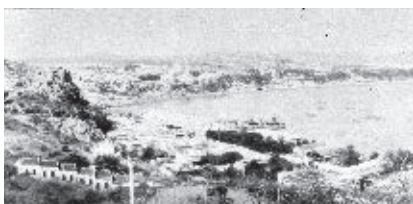
Bahía de Mazatlán, 1920.