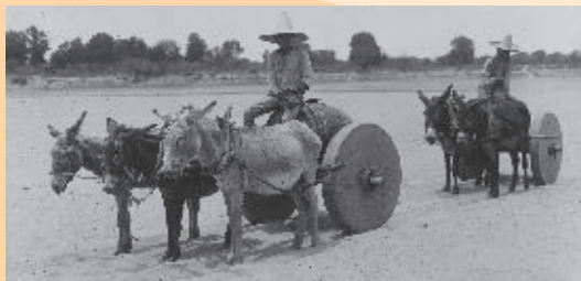
Recua para el transporte de mercancías en el siglo XIX.

Durante el siglo XIX, en Sinaloa se utilizó la arriería. Un arriero es una persona que trabaja transportando mercancías, como café, paja, leña, trigo, carbón y muchas otras cosas, con ayuda de varias bestias, que pueden ser burros o mulas, a las que denominaban recuas .