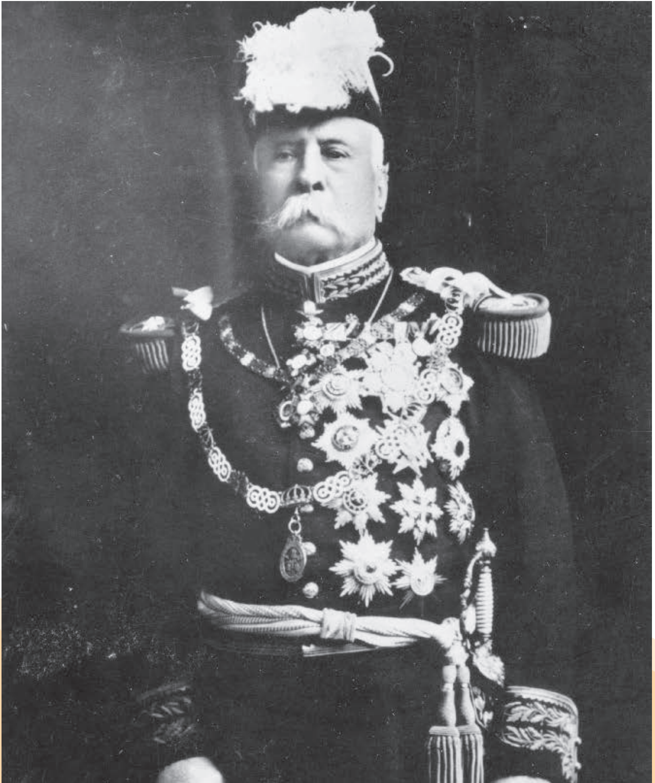
Porfirio Díaz, ca. 1911.