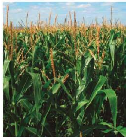
Cultivo de maíz.