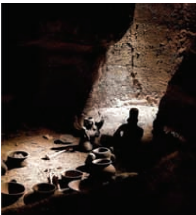
Tumba de tiro en el Museo Regional de Guadalajara.