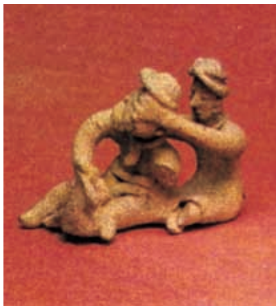
Escultura de juegos de niños.