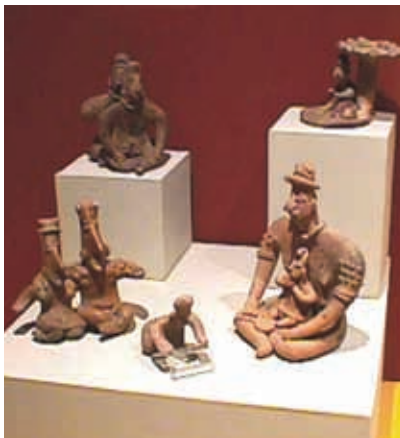
Esculturas de vida cotidiana.