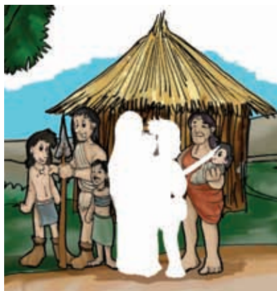
Bandas o tribus de las primeras familias en el continente americano.