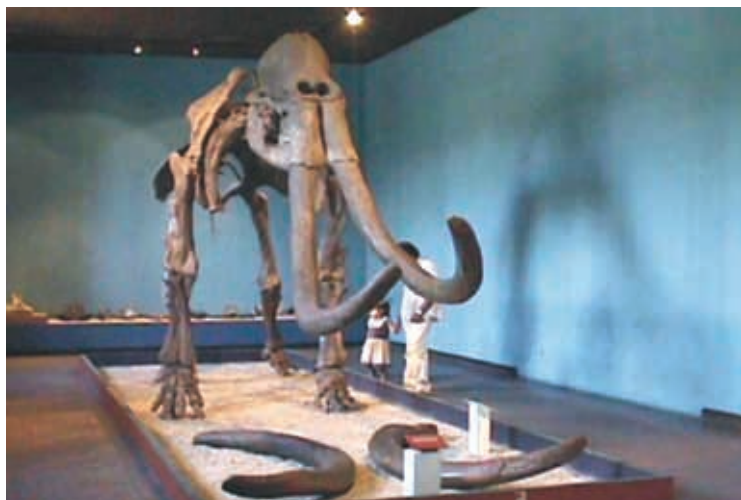
Mamut, Museo Regional de Guadalajara.