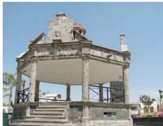
Plaza Principal de El Salto.