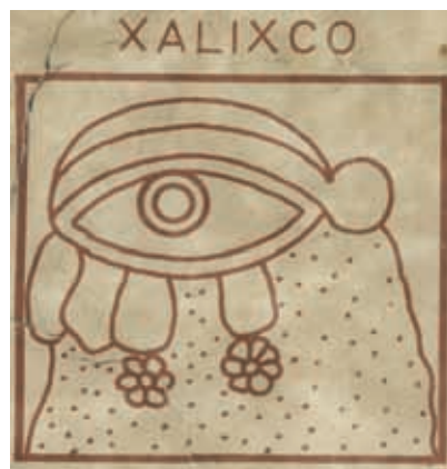
Detalle de la representación del significado de Xalisco, Lienzo de Tlaxcala, lámina 53.

La capital de mi entidad, es la ciudad de Guadalajara. Junto a ella se encuentran los municipios de Zapopan, Tlaquepaque, Tonalá, Tlajomulco de Zúñiga y El Salto, estos municipios forman la zona metropolitana.