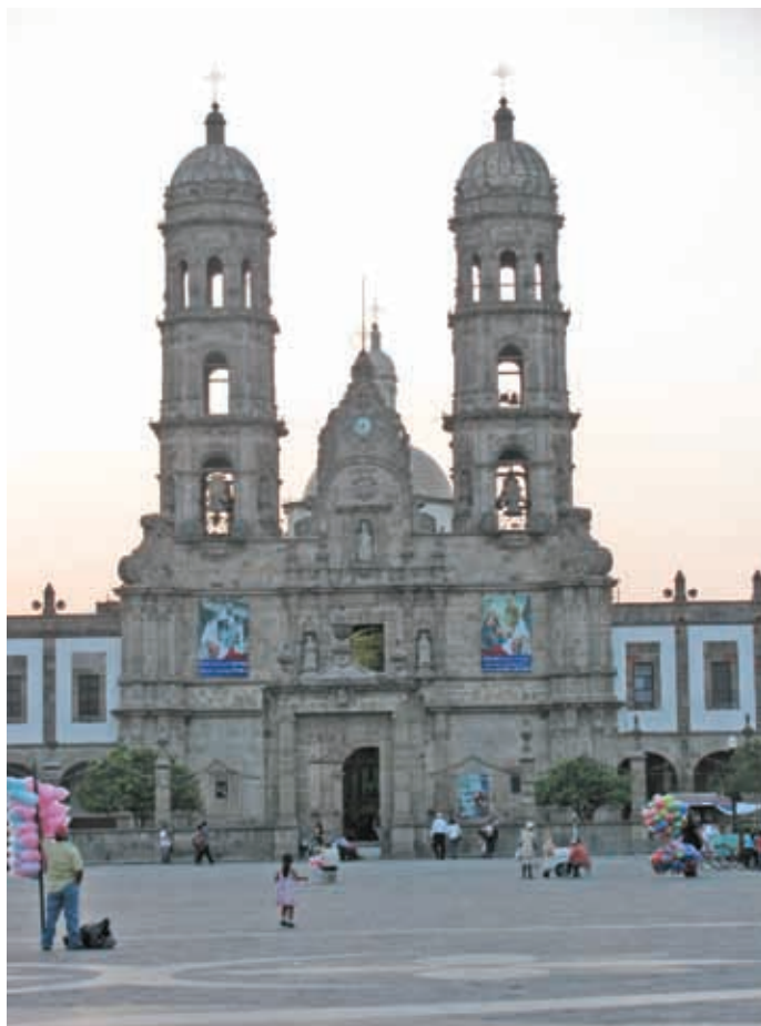
Basílica de Zapopan.