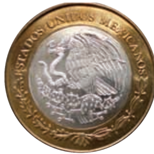
Moneda de 10 pesos.