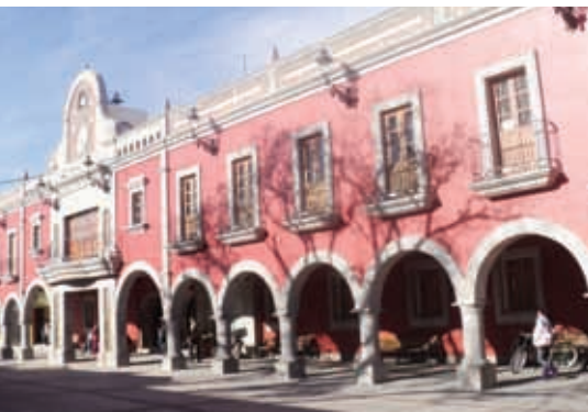
Palacio municipal de Tonalá.