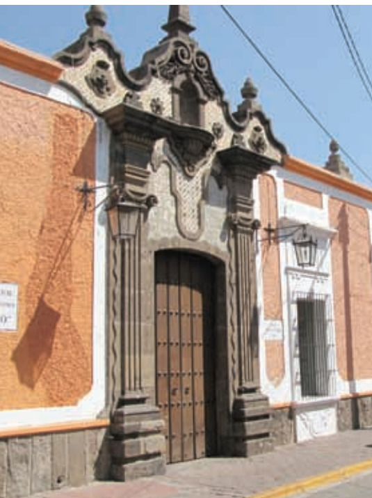
Centro Cultural El Refugio.