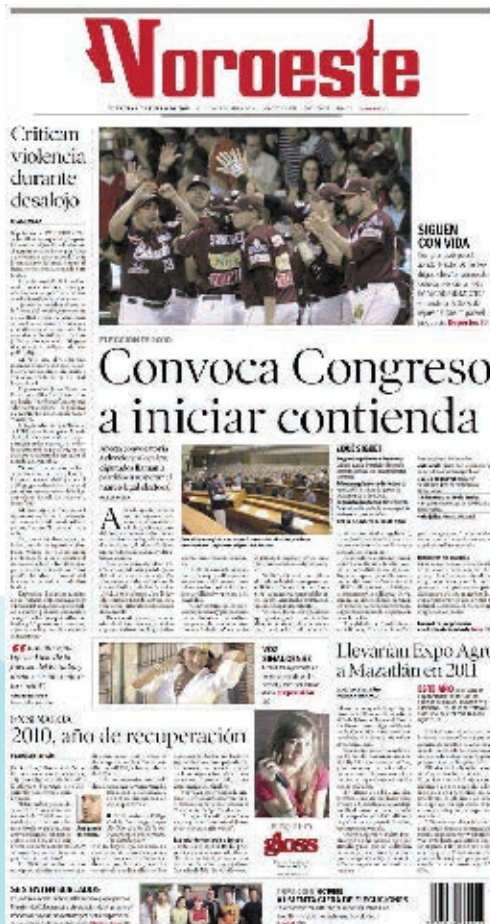
Periódico actual de Sinaloa.