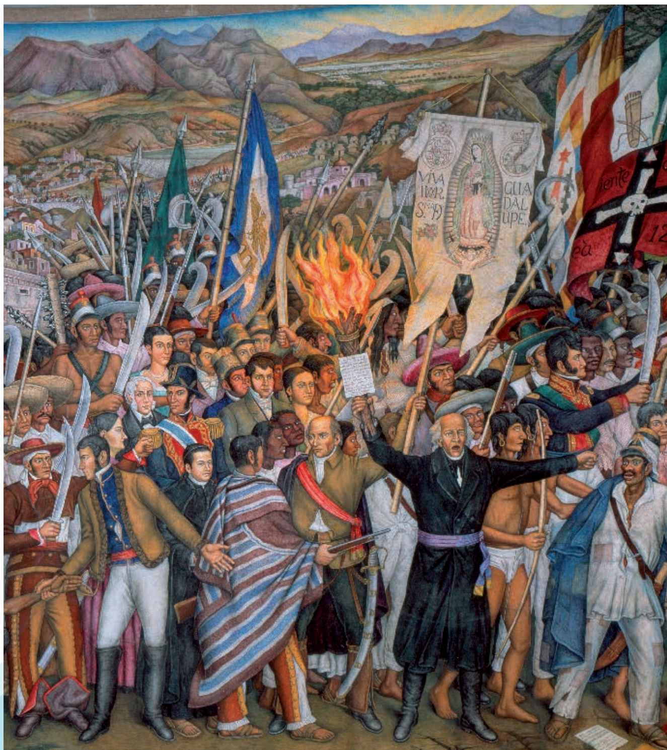
Retablo de la Independencia , 1960-1961 (detalle), Juan O'Gorman, fresco, Museo Nacional de Historia.