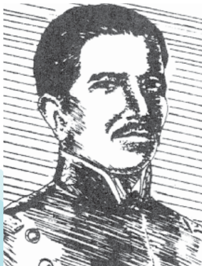
José María González de Hermosillo, iniciador de la Independencia de México en Sinaloa.