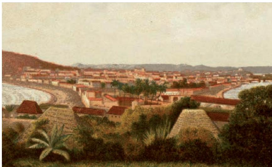
Puerto y bahía de Mazatlán.

Así eran las casas en la época del movimiento de Independencia en algunas zonas serranas y costeras de Sinaloa. Actualmente aún se pueden observar algunas de ellas.