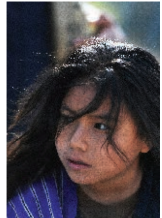
► Niña de Santa María Acapulco, en el municipio de Santa Catarina.