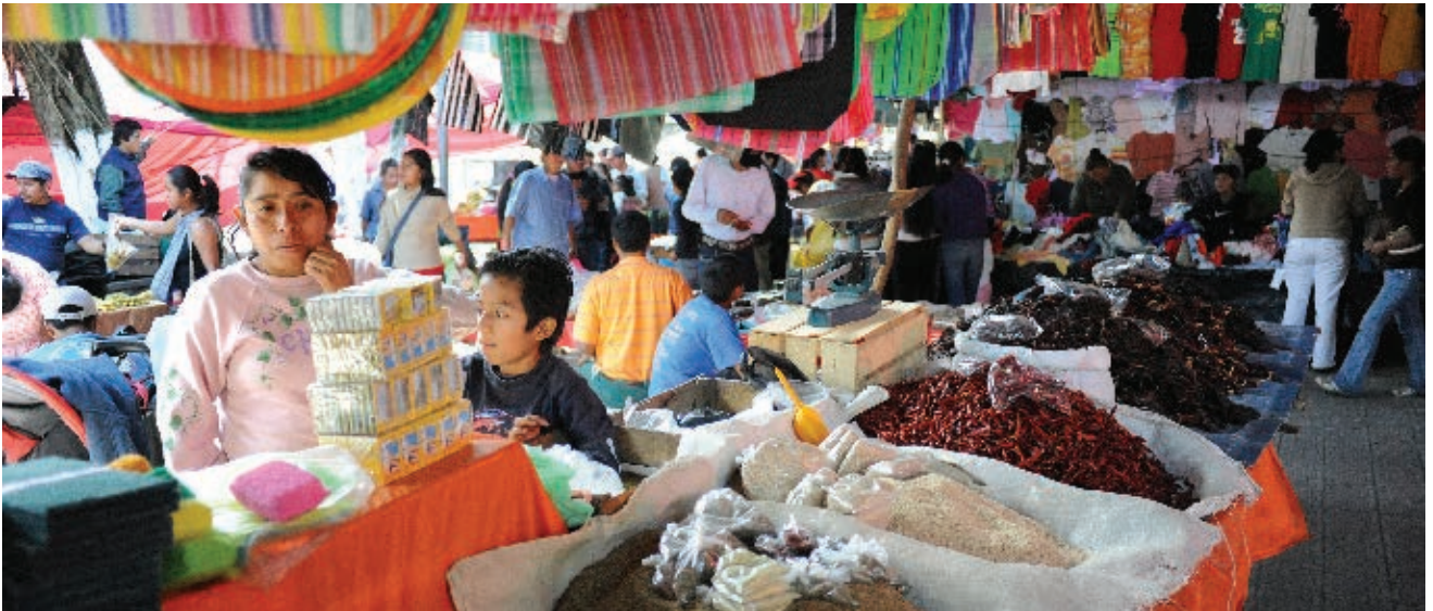
► Mercado dominical de Tancanhuitz.