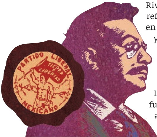
► Ricardo Flores Magón.

Socialistas. Personas que apoyan la idea de que la propiedad y la riqueza no deben pertenecer sólo a una clase social, sino que deben beneficiar a toda la comunidad.