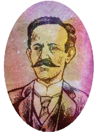
► Antonio Díaz Soto y Gama fue parte de las luchas obreras y campesinas como pensador, diputado y periodista.

Los integrantes del grupo liberal fueron ferozmente perseguidos y amenazados por la policía; también los encarcelados y, finalmente, algunos tuvieron que salir del país.