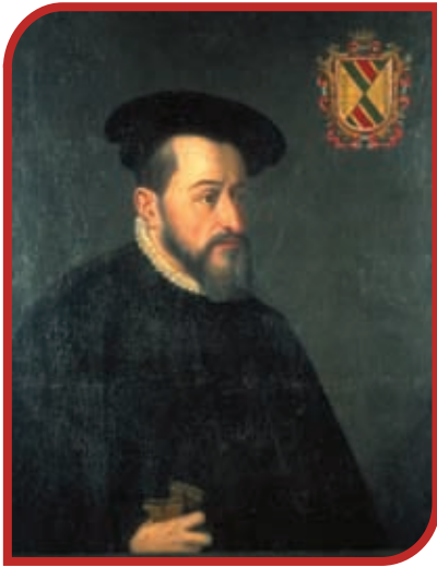
Antonio de Mendoza, primer virrey de la Nueva España.

Desde el siglo XVI hubo funcionarios menores: los corregidores, que eran jueces, y los alcaldes mayores, responsables de coleccionar el tributo indígena y de controlar en su jurisdicción a las repúblicas de indios. Estos pueblos vivían en sus comunidades, separados de los españoles, y elegían a sus propios gobernadores. Como se muestra en el mapa “Cabeceras de jurisdicciones territoriales en el Virreinato” los corregimientos y alcaldías mayores, denominadas subdelegaciones a partir de 1786, tuvieron su sede en pueblos y ciudades que hasta la fecha son cabeceras municipales en nuestro estado.