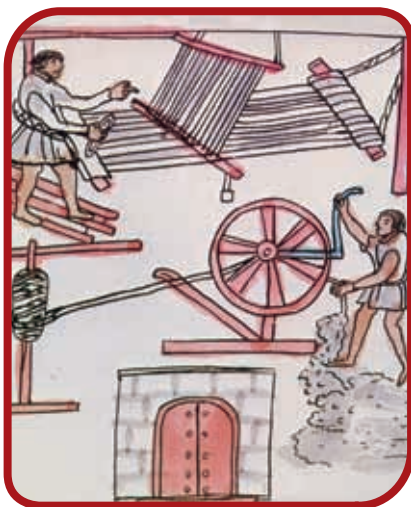
Obraje (taller de textiles), Códice Osuna.

¿Cuáles son las actividades que realizaban las personas de los pueblos y ciudades virreinales?