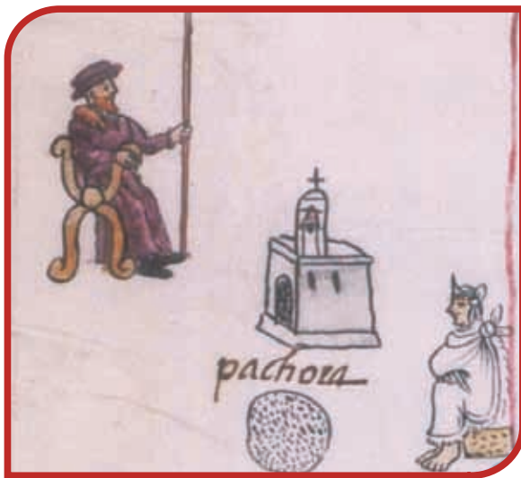
Sometimiento de la autoridad indígena a la española en Pachuca, Lienzo de Zempoala, detalle inferior izquierdo girado.

Al inicio de la conquista militar, la población española era considerablemente menor a la indígena y, aunque se sumaban más con cada barco que llegaba, necesitaban a los gobernadores de los indios para controlar a tanta población. Por eso respetaron los privilegios de la nobleza indígena y ésta se adaptó a los conquistadores.