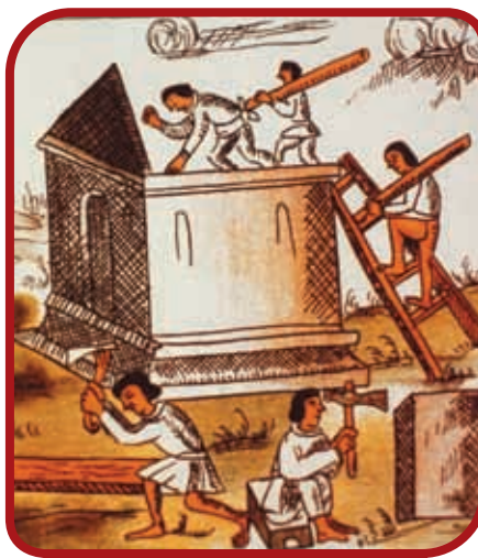
Construcción de los cimientos de una iglesia, Códice Florentino.