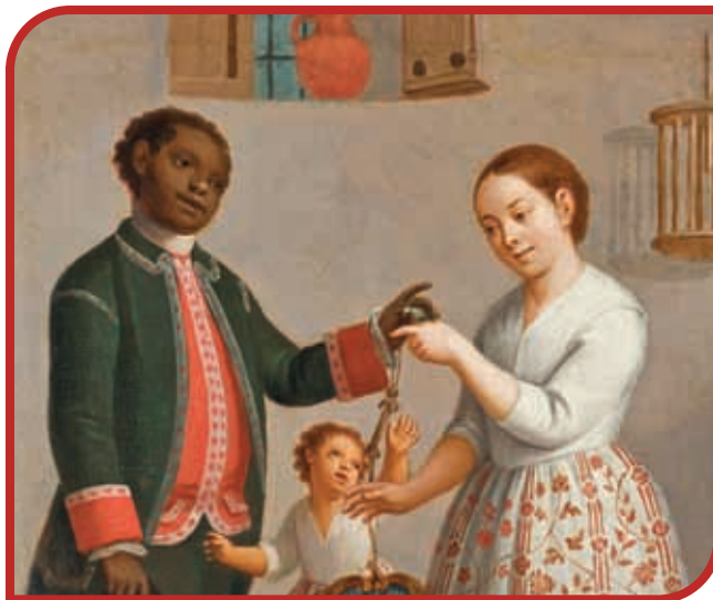
Negro y española: mulato.

Con el tiempo se integró una nueva sociedad, formada en su mayor parte por población indígena, española (peninsular si provenía de España, criolla la nacida en América) y, en menor proporción, la negra traída de África. De la mezcla de estos tres grupos surgió el mestizaje y las llamadas castas, por ejemplo mestiza, mulata y castiza. Observa las imágenes siguientes.