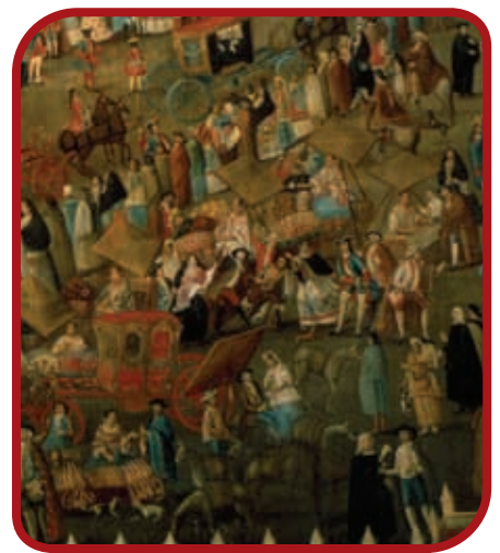
Un día en la plaza durante el Virreinato.