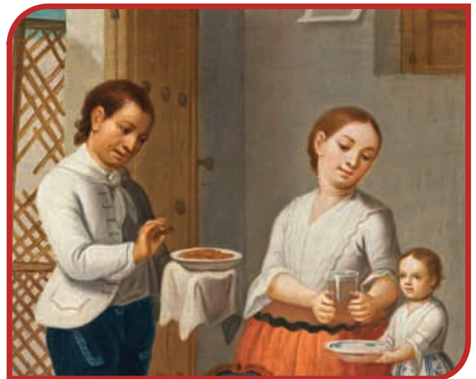
Mestizo y española: castiza.

En la sociedad de la Nueva España había ricos y pobres. La población española peninsular concentró gran parte de la riqueza, obtenida mediante el trabajo de la mayoría, disfrutó de privilegios y ocupó altos puestos en el gobierno. Sin ventajas, el resto de la población se dedicaba a labores en el campo, las minas o al servicio doméstico; quienes procedían de África lo hacían en condición de esclavitud.