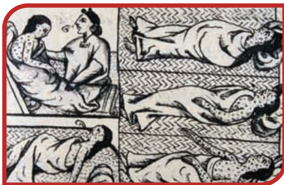
Epidemia de viruela, Códice Florentino.

Los gobernadores indígenas, llamados “señores principales”, no pagaban impuestos, pero sí cobraban lo de las comunidades. Con los frailes, sus hijos aprendían a leer y escribir en náhuatl, otomí, español y algunos hasta en latín. Sin embargo, todos tuvieron que aceptar la religión católica y la nueva estructura de poder.