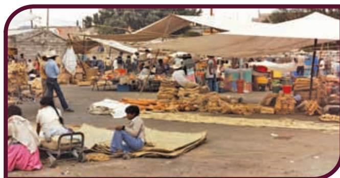
Tianguis en Ixmiquilpan.

Los mercados y los tianguis son lugares a los que acuden personas de varias localidades a comprar o vender productos. Éstos se agrupan por su similitud: las telas y la ropa se concentran en un solo lugar; en otro, los alimentos, las frutas y verduras; los objetos de barro y piedra, en un sitio distinto, y por separado, los animales.