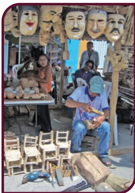
Artesanías de madera, Orizatlán.