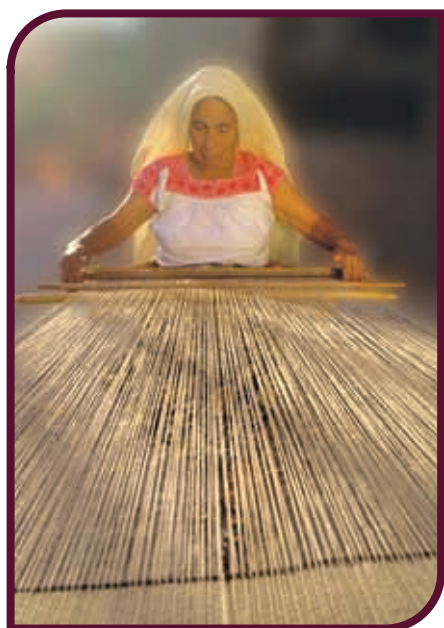
Telar de cintura, Huasteca.

Muchas artesanías, como los bordados y los productos de barro, de madera o de palma, son una herencia de nuestros antepasados.