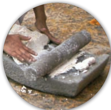
Metate y metlapil.

Para cocinar se emplean algunos utensilios como el metate, el metlapil, el molcajete y el comal, hojas de maíz, de papatla y pencas de maguey.