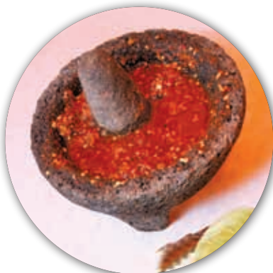
Molcajete y tejolote.