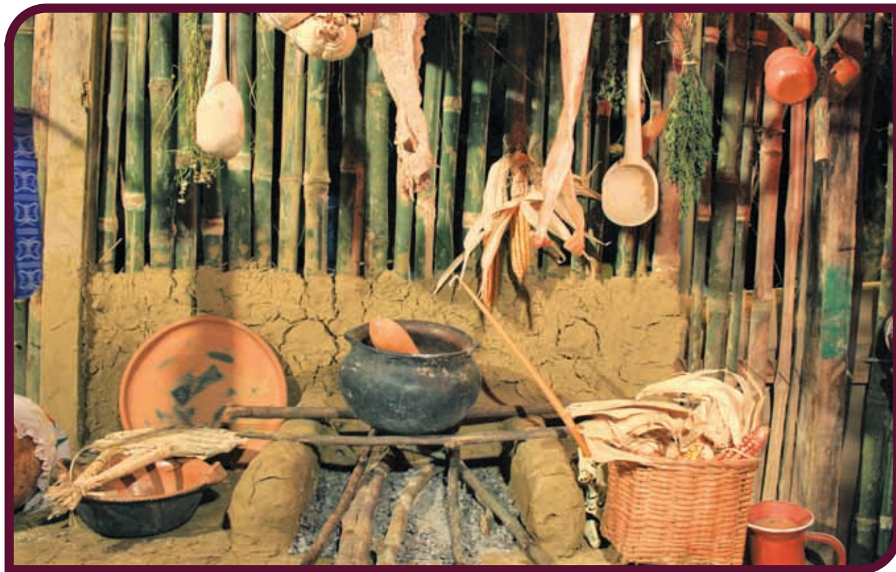
Cocina con utensilios de barro y madera, Huasteca.

Cada día se incorporan nuevos objetos y utensilios de uso común a nuestra vida diaria, pero hay muchos otros que siguen elaborándose de la misma forma que en la época prehispánica.