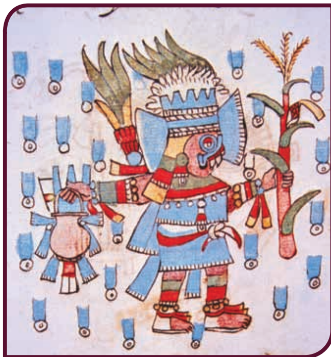
Tláloc con una planta de maíz, Códice Vaticano.

Huémac fue el vencedor, pero sus rivales lo engañaron dándole hojas y mazorcas de maíz en vez de plumas y piedras preciosas. Huémac las despreció y los tlaloques, enojados, provocaron granizadas que destruyeron el maíz, razón por la cual los toltecas padecieron hambre. Los rezos y ofrendas no sirvieron para contentar a los tlaloques.