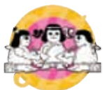
Quetzalcóatl, Códice Florentino.

Después de leer y comentar la leyenda de Quetzalcóatl, copien y contesten en el “Cuaderno de mis trabajos” lo siguiente: