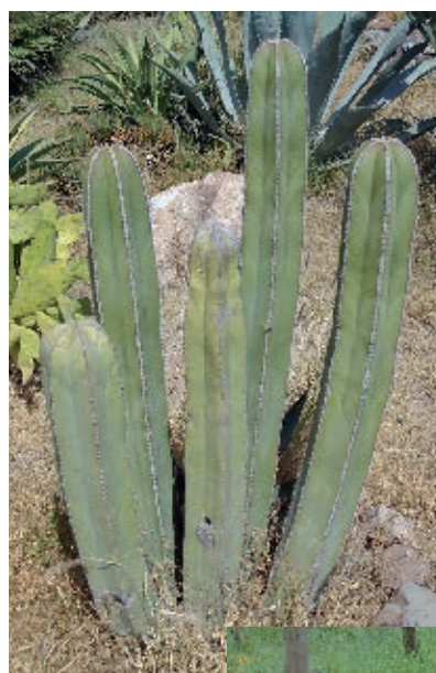
Es importante mantener en su hábitat la gran variedad de vegetación de clima seco o semiseco, aunque parezca que puede ser doméstica.