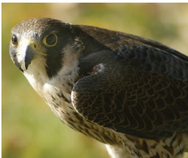
El halcón peregrino es una especie en peligro de extinción. Algunos ejemplares se encuentran protegidos en la Reserva de la Biosfera Sierra Gorda.

Otro problema ambiental muy grave es el tráfico de vegetación y fauna silvestres. Consiste en capturar animales o extraer plantas de las zonas de conservación natural para venderlos ilegalmente. Esa actividad ha traído como consecuencia que algunos tipos de vegetación y fauna estén en peligro de extinción.