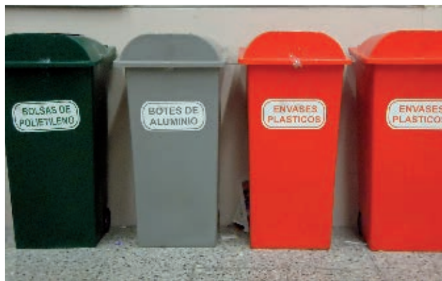
Parece complicado, pero separar la basura orgánica de la inorgánica o llevar los envases reciclables a los centros de recolección es un buen comienzo.