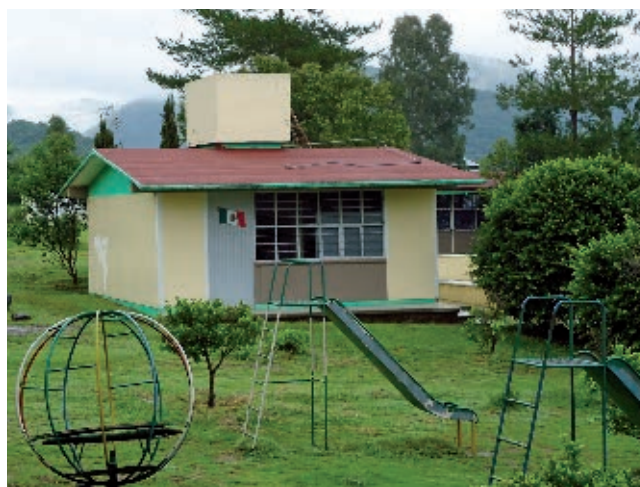
Uno de los avances más importantes de nuestra entidad es que cada vez más niños tienen acceso a la educación.

La situación cambió en la segunda mitad del siglo XX, ya que un mayor número de calles y avenidas en el estado comenzaron a tener alumbrado público, y las casas, luz eléctrica. El agua potable y el drenaje se introdujeron también en muchos hogares. La instalación de teléfonos en casas particulares fue cada vez mayor. Sin embargo, no todos tenían, así que quienes contaban con ese servicio lo prestaban o rentaban a otras personas.