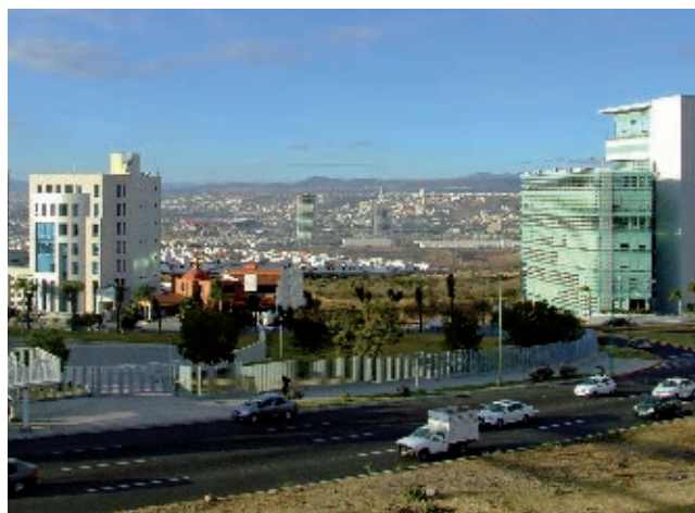
Los modernos edificios son una señal distintiva del nuevo rostro de Santiago de Querétaro.

Aunque la industrialización se ha concentrado en los municipios mencionados, muchos pueblos en zonas rurales se han transformado en pequeñas ciudades, como Tequisquiapan o Jalpan de Serra, esta última en la Sierra Gorda.