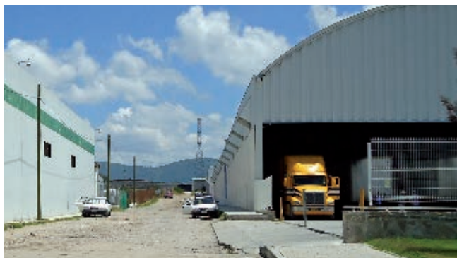
Las fábricas son un elemento cotidiano del paisaje actual en la región urbana de nuestra entidad.

La llegada de empresas provocó que muchas personas se trasladaran principalmente a las dos ciudades más grandes: Santiago de Querétaro y San Juan del Río, que fueron creciendo hasta convertirse en las grandes concentraciones urbanas de la actualidad. Esa situación ocasionó que, poco a poco, construcciones modernas, como edificios industriales y de oficinas, así como fábricas, estadios y auditorios, compartieran el paisaje con las edificaciones de la época virreinal.