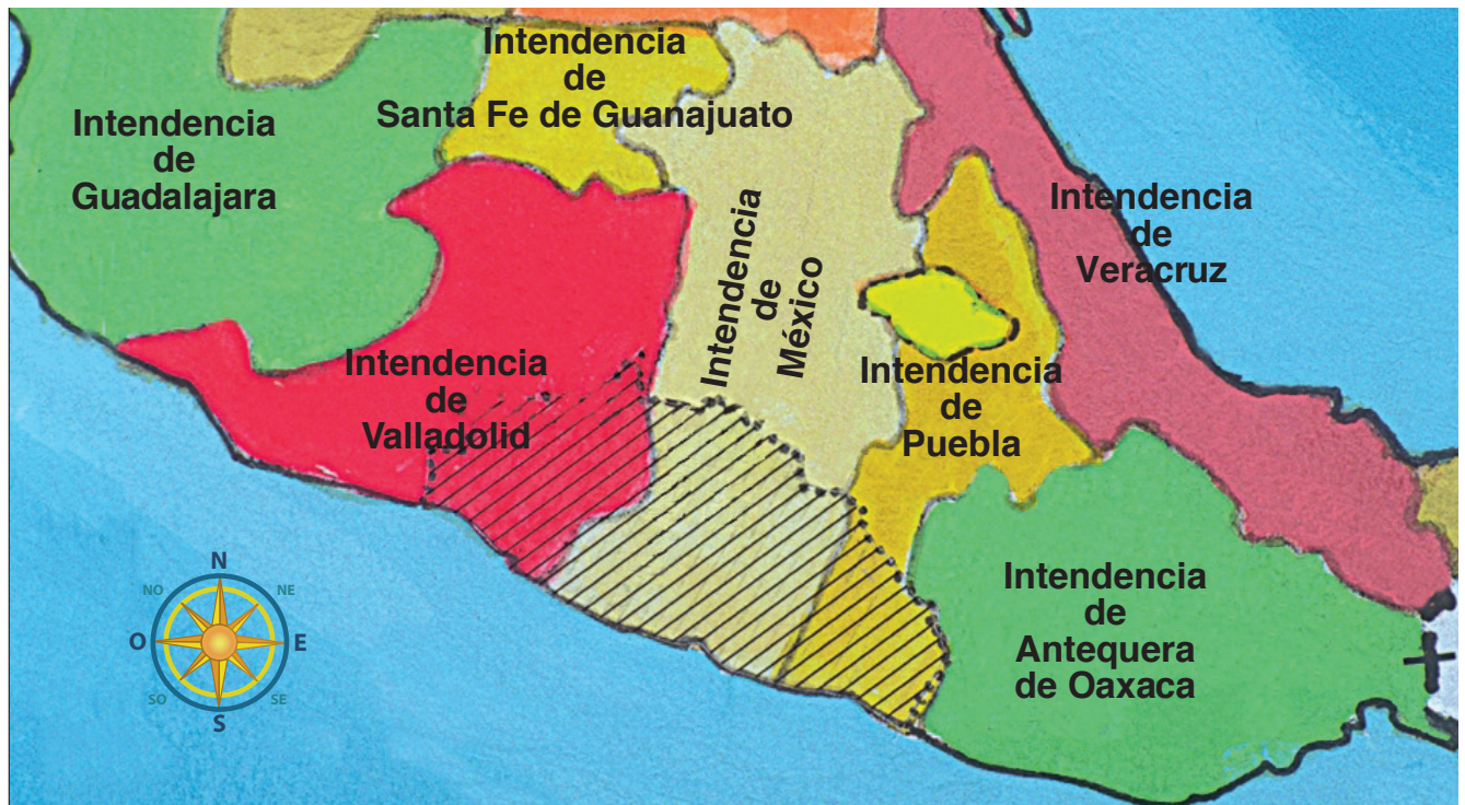
Las intendencias de México, Puebla y Valladolid al finalizar la época virreinal.

El rey Carlos III, influido por la Ilustración, implantó las reformas borbónicas en Nueva España y en 1786 el territorio se reorganizó en 12 intendencias. Con esta fragmentación, el actual estado de Guerrero quedó comprendido dentro de las intendencias siguientes: en la Intendencia de México se formaron los partidos de Chilapa, Tixtla, Iguala, Acapulco y Tepecoacuilco; en la de Valladolid, Zacatula y los poblados de Zirándaro, Pungarabato y Cutzamala, y en la de Puebla, el de Tlapa.