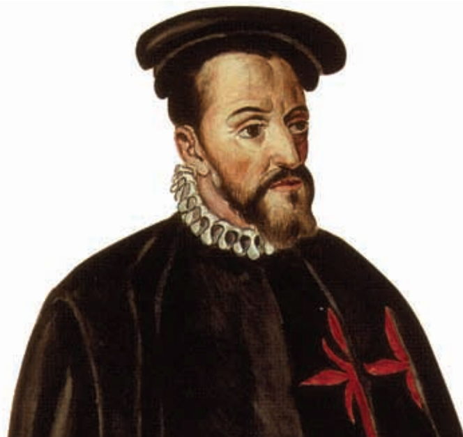
Antonio de Mendoza, primer virrey de la Nueva España, 1535.

En 1535 se instituyó el Virreinato, siendo el primer virrey Antonio de Mendoza, quien representaba a la autoridad real y tenía a su cargo el poder ejecutivo; era presidente de la audiencia y capitán general del ejército. Para el virrey, se designaron corregidores, llamados así porque su función era la de corregir o compensar la fuerza política de los encomenderos, quienes recaudaban directamente los tributos de los pueblos en Nueva España.