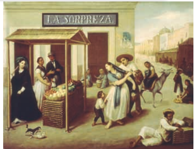
La Sorpresa (sic), 1850, Agustín Arrieta (1802-1874).