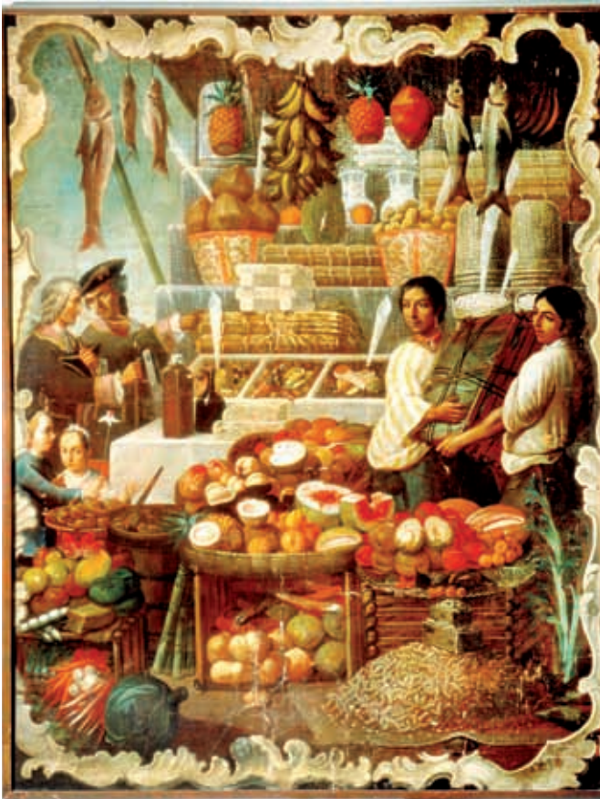
Puesto en el mercado, 1766, anónimo.