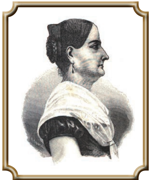
Josefa Ortiz de Domínguez.

Uno de los personajes más importantes de la historia de México vivió en Santiago de Querétaro. Se trata de Josefa Ortiz de Domínguez, la Corregidora . Se le conoce con ese nombre porque era esposa del encargado del gobierno en ese entonces, el corregidor Miguel Domínguez.