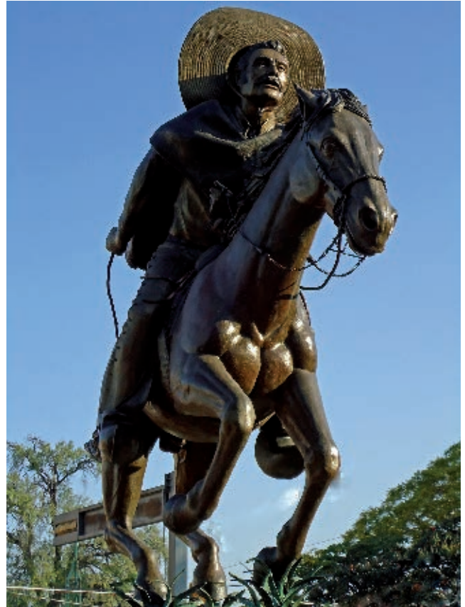
Monumento a Ignacio Pérez en la calle de Corregidora, Santiago de Querétaro.

En el libro de José Manuel Villalpando, Miguel Hidalgo, México , SEP-Santillana, 2005 (Libros del Rincón), puedes conocer más información acerca de “El padre de la patria”.