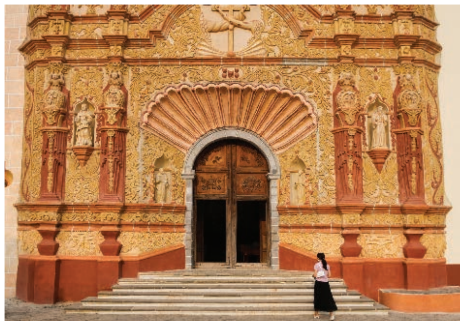
Fachada del templo de la misión de Jalpan de Serra, dedicada a Santiago Apóstol.