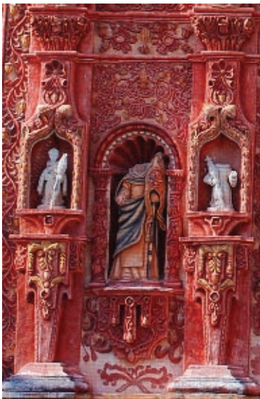
Templo de la misión de Landa de Matamoros, dedicada a Santa María de las Aguas de Landa.

En las fachadas de las misiones e iglesias labraron elementos de su antigua religión, además de los santos y ángeles de los españoles.