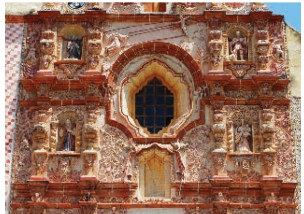
Templo de la misión de Tancoyol, dedicada a la virgen de la Luz.