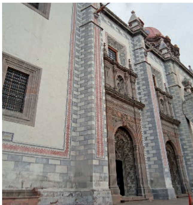
Templo de Santa Rosa de Viterbo, construida en el siglo XVIII.

No sólo en dicha ciudad se hicieron construcciones durante el Virreinato. En otros municipios hay templos, edificios y casas de esa época que aún se conservan. En la Sierra Gorda, fray Junípero Serra dirigió la construcción de misiones con la intención de convertir a los indígenas en católicos.