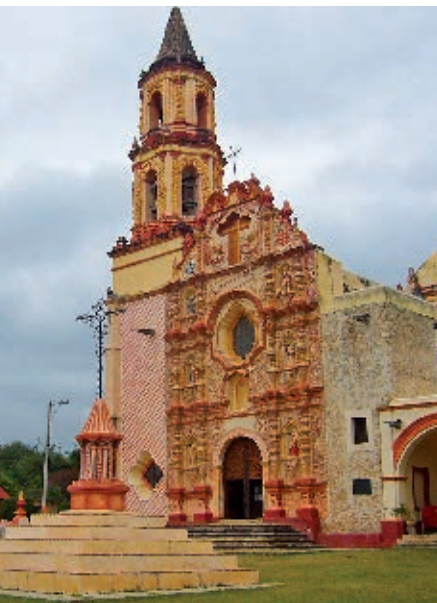
Templo de la misión de Tilaco, dedicada a San Francisco de Asís.

Localización de las misiones franciscanas en la Sierra Gorda.