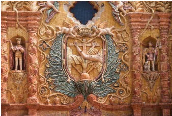
Templo de la misión de Concá, dedicada a San Miguel Arcángel. Esa misión se halla enclavada en la Sierra Gorda, en el municipio de Arroyo Seco.

Los indígenas fueron obligados a construir los templos católicos, pero no aceptaron la nueva religión sin oponer resistencia. En algunos casos cubrieron sus propios altares religiosos con piedras y les colocaron una cruz encima. Así parecía que rezaban frente a una cruz, cuando en realidad lo hacían pensando en sus dioses.