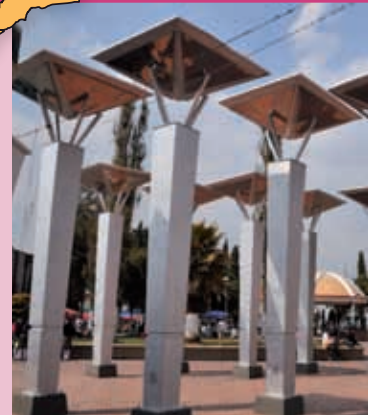
Jardín en el centro de la cabecera municipal.