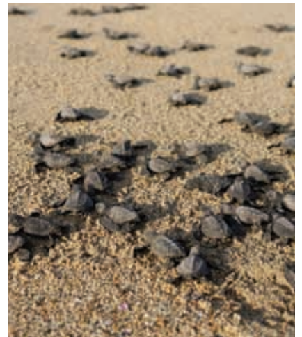
Tortuga golfina, Ixtapa.