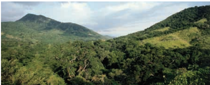
Selva baja, Ixtapa.