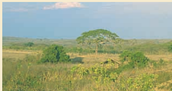
Valle de Tixtla de Guerrero.