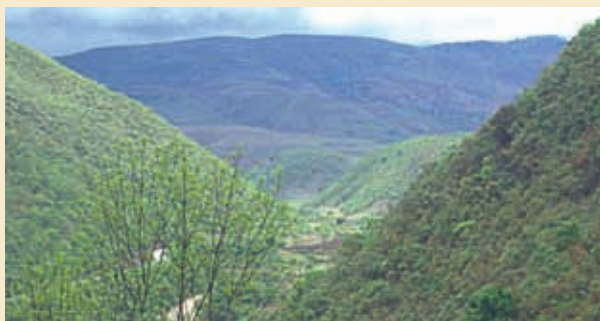
Sierra Madre del Sur.