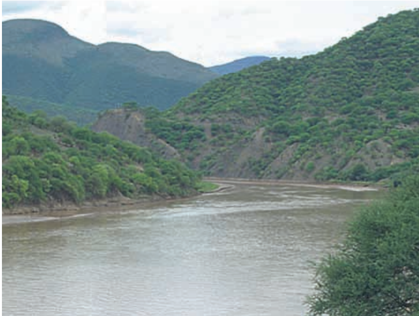
Depresión del río Balsas.