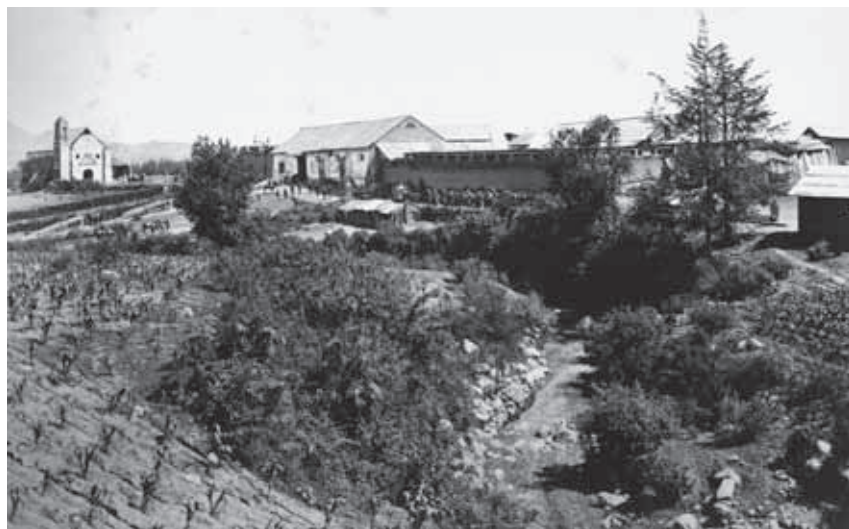
Hacienda de Guadalupe, 1885.