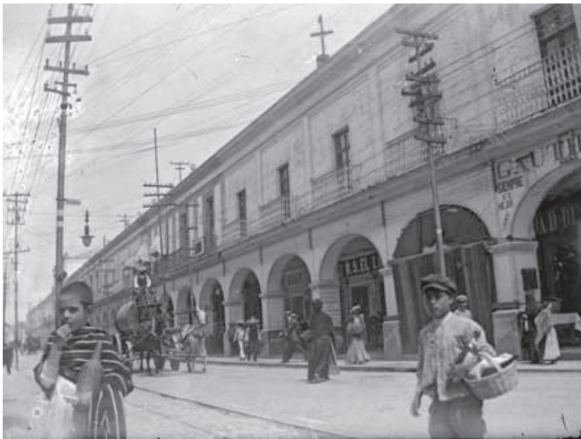
Calle de la ciudad de Toluca, 1910.