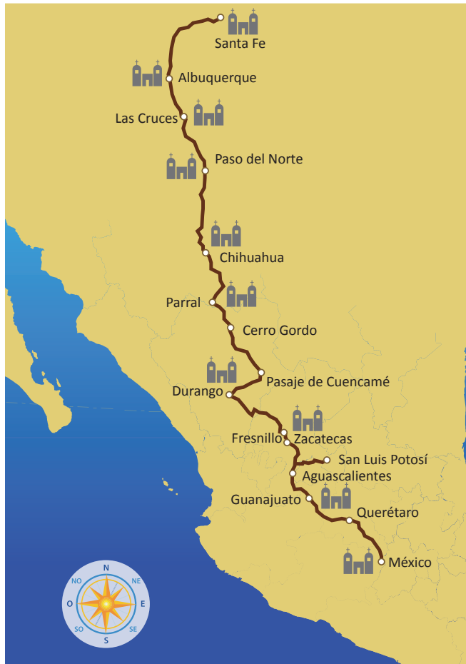
Este mapa muestra el Camino de la Plata.

A lo largo del Camino de la Plata se establecieron los presidios, que eran edificios construidos como fortalezas militares con la función de resguardar y proteger a los arrieros , que llevaban sus recuas cargadas de mercancías, para que descansaran y pasaran la noche antes de continuar su viaje. Los presidios aumentaron su población cuando algunas personas se quedaron a vivir ahí; después de un tiempo, se convirtieron en villas y luego en ciudades.