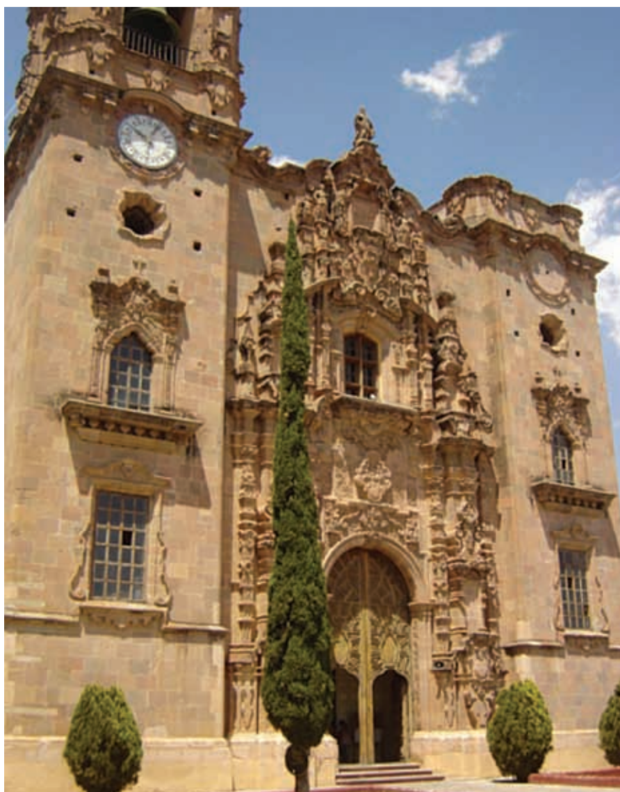
Templo de San Cayetano en Mineral de Valenciana.

Se construyeron las casas, los edificios y los templos sobre los cerros, formando estrechos callejones y calles desiguales. Un ejemplo claro de ello, es la ciudad de Guanajuato.