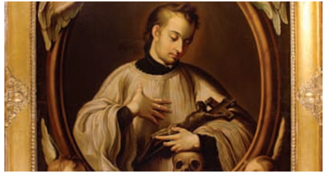
Los sacerdotes realizaron la labor evangelizadora.

Junto con la conquista militar tuvo lugar la conquista espiritual. Con los conquistadores, exploradores y mineros, llegaron también sacerdotes; algunos pertenecían a órdenes religiosas, como los agustinos, dominicos, franciscanos, jesuitas, carmelitas y juaninos; estos misioneros se dedicaron a enseñar la religión católica a los habitantes indígenas.