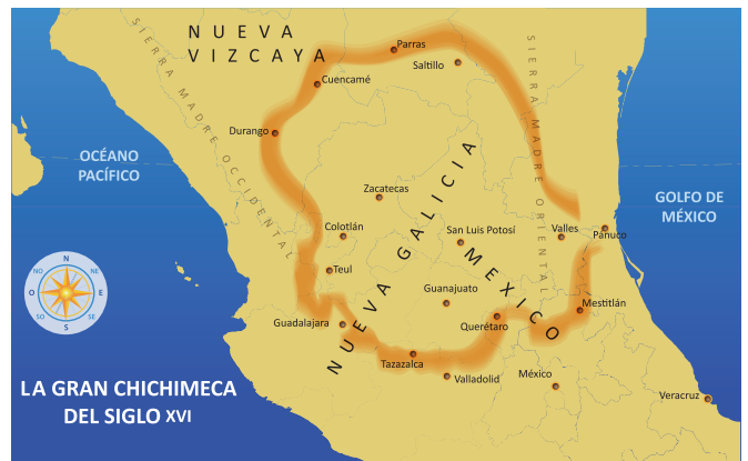
Mapa la Gran Chichimeca.

En 1530, Nuño de Guzmán organizó otra expedición al norte, viajó cerca del cauce del río Lerma y llegó al actual territorio de Guanajuato, en donde vivían algunos grupos indígenas como los chichimecas, que eran tribus nómadas dedicadas a la guerra, y los purépechas o tarascos al sur del estado quienes