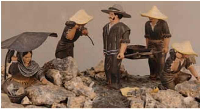
En las minas trabajaban muchas personas.