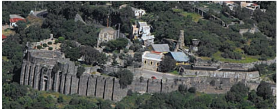
Mina en Guanajuato.

La llegada de más mineros provocó que la región se poblara y sus habitantes demandaran más servicios y artículos, lo que favoreció la fundación de poblados, haciendas y ranchos cercanos a Guanajuato, como las ciudades de León y Celaya.