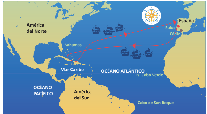
Viaje de Cristóbal Colón en 1492.

Con el tiempo arribaron cada vez más viajeros al continente americano; entre ellos venía Hernán Cortés, quien después de un largo recorrido, llegó a la ciudad de México-Tenochtitlán, capital del imperio azteca, y se enfrentó al emperador Moctezuma, derrotándolo en 1521. Con este suceso, se inició la época virreinal en México, quedando bajo el control