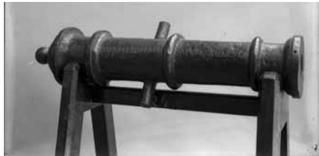
Los españoles derrotaron a los indígenas debido a que poseían mejores armas de metal.

Después de varios años de lucha, los indígenas fueron derrotados por los españoles, pues ellos tenían mejores armas hechas con metales, contaban con el caballo y sabían manejar la pólvora para detonar los cañones, lo que asustaba mucho a los indígenas, que sólo tenían armas de madera y piedra. Entre 1594 y 1598 se sometieron muchos indígenas, así se fundó San Luis de la Paz.