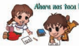
Ahora nos toca hacer

Observa la siguiente línea de tiempo y, con la información que aparece en ella, completa correctamente cada pregunta encerrando en un círculo la respuesta, puedes reunirte en equipos de cuatro integrantes. Si lo requieres, haz tus operaciones matemáticas en una hoja de papel aparte.