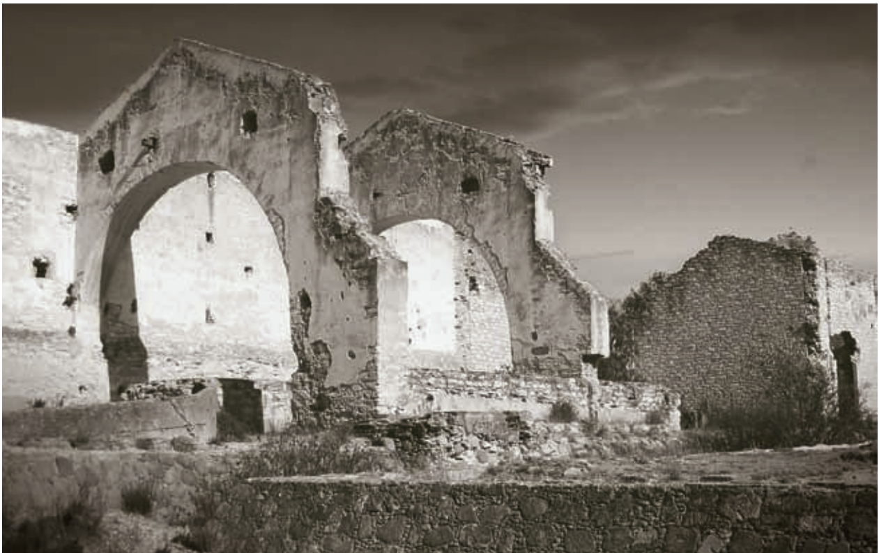
Ruinas arquitectónicas en la Misión de Chichimecas.

Con el tiempo llegaron los chichimecas. Fueron un grupo de pueblos indígenas cazadores y recolectores que habitaron casi todo el territorio de Guanajuato hacia el año 1200 d.C.