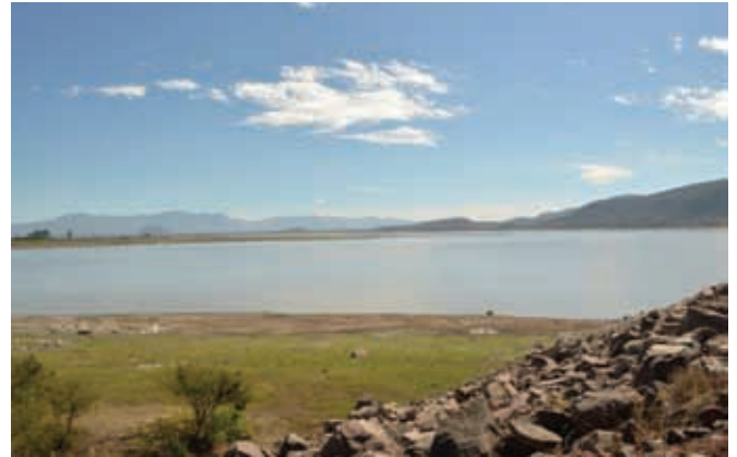
La presa Solís se encuentra en el municipio de Acámbaro.

Al iniciar la construcción de la presa Solís, cerca de la ciudad de Acámbaro, en el sureste de la entidad, unos trabajadores encontraron restos de cerámica y fósiles humanos, lo cual hizo que se iniciaran los primeros estudios que dieron lugar al conocimiento de esta cultura.