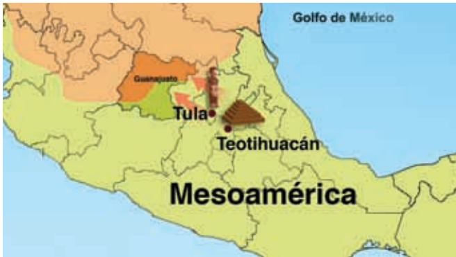
Ubicación de Tula y Teotihuacán.

También en esos años, estos lugares fueron poblados por grupos con influencia teotihuacana y tolteca. Los teotihuacanos fueron un gran imperio en Mesoamérica. Era una cultura teocrática: el poder lo tenían los sacerdotes, quienes poseían los conocimientos y controlaban todos los aspectos religiosos y económicos.