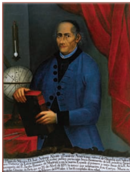
José Antonio Alzate y Ramírez, El Plinio de México . Sabio mexiquense que nació en Ozumba en 1737.

Durante el periodo virreinal algunos lugares que hoy forman parte de nuestra entidad fueron cuna de escritores y científicos cuyas obras son parte de nuestra herencia cultural.