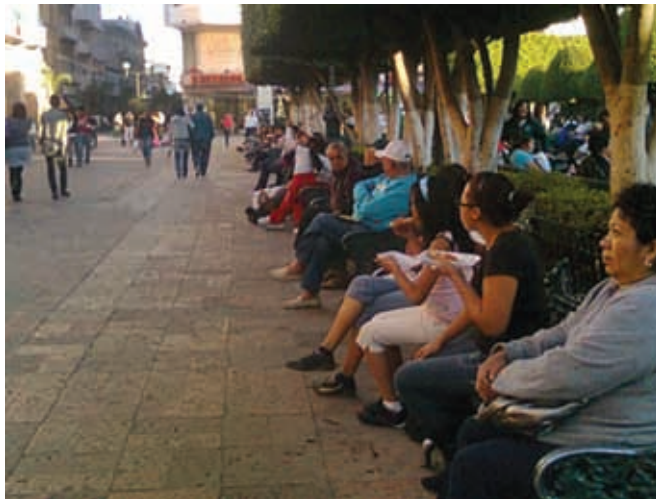
Habitantes de la ciudad de León.

Para conocer las características de la población se realizan en el país, cada 10 años, los censos de población. Es probable que hayas escuchado hablar del Inegi, es decir, el Instituto Nacional de Estadística y Geografía.