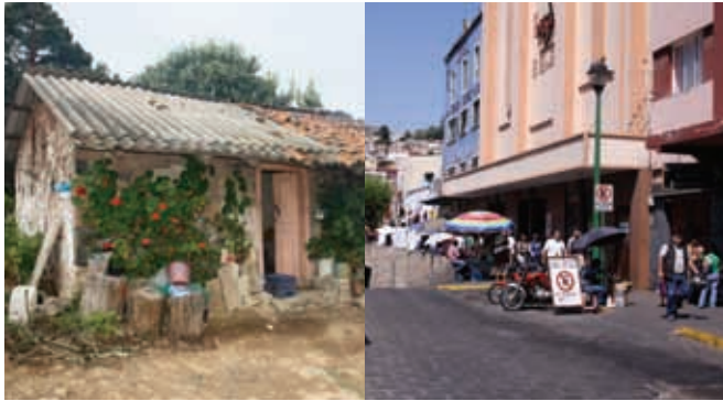
Zona rural y zona urbana.

A los lugares o localidades en donde las personas viven en ciudades o poblados con más de 2 500 habitantes se les conoce como localidades o poblaciones urbanas. En ellas hay servicios de agua, luz, gas, teléfono y drenaje; las construcciones se encuentran cercanas unas a otras; hay casas, edificios, avenidas, hospitales, escuelas, parques, fábricas, oficinas, aeropuertos, supermercados, entre otros.