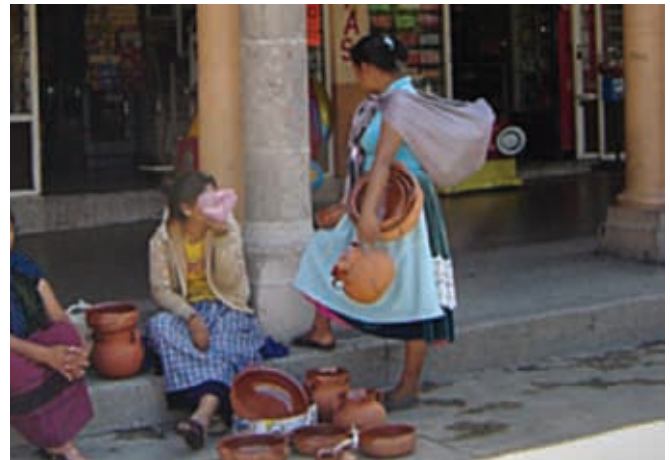
En Guanajuato habitan personas que pertenecen a diferentes grupos étnicos.

Uno de los aspectos que los caracteriza es su lengua, la mayoría de ellos habla una propia. También se distinguen por su vestimenta, pues conservan algunas prendas de vestir como las que usaban antes de la llegada de los españoles. En algunos casos, las mujeres se encargan todavía de elaborar la ropa que usa la familia; les gusta adornarse con pulseras, aretes y collares, que a veces elaboran para vender como se puede apreciar en algunas ciudades como Guanajuato.