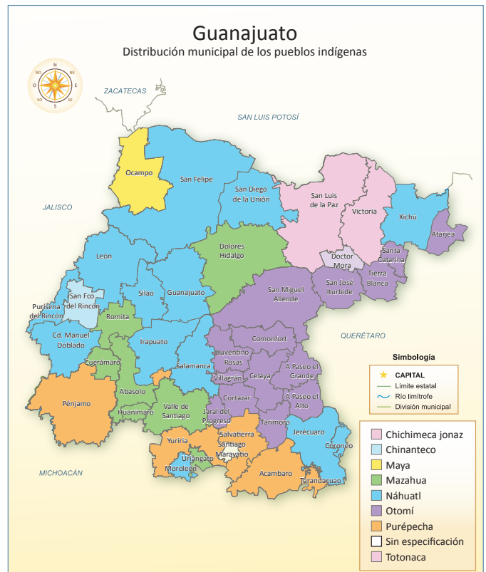
Los diversos grupos indígenas que habitan en el estado de Guanajuato.

Son destacados artesanos que hacen artículos con barro, algodón o paja, entre otros materiales, para crear hermosos objetos admirados por su belleza en todo el mundo. En los siguientes temas se conocerá su origen y forma de vida.