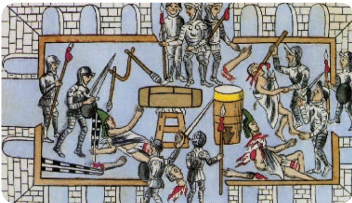
➤ Matanza del Templo Mayor organizada por Pedro de Alvarado, Códice Durán .

Una noche, los españoles presenciaron una ceremonia indígena en el Templo Mayor. Los conquistadores atacaron al grupo de danzantes y los mexicas no pudieron defenderse pues estaban desarmados. Este hecho dio como resultado lo que en la historia se conoce como la Matanza del Templo Mayor.