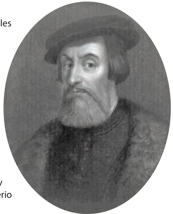
➤ Hernán Cortés (1485-1547).

Diego Velázquez le había ordenado a Cortés que regresara tan pronto como explorara la zona, pero Cortés desobedeció las instrucciones del gobernador y avanzó al interior del territorio para conquistar el imperio de Moctezuma.