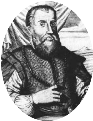
➤ Diego Velázquez (1465-1524), gobernador de Cuba.