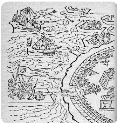
➤ Pequeños barcos atacan México-Tenochtitlan desde el lago, Códice Florentino .

Los mexicas hicieron prisioneros a varios españoles que intentaron huir, y muchos otros se hundieron en los canales más profundos con sus caballos. Después de esa batalla, Cortés se dio cuenta de la derrota y decidió refugiarse en Tlaxcala. Se dice que antes de abandonar la ciudad, el comandante se detuvo bajo un ahuehuete en Popotla, donde lloró.