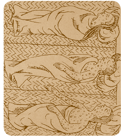
➤ Indígenas enfermos de viruela, Códice Florentino .

Cortés emprendió la ofensiva. Con el apoyo de los tlaxcaltecas, el ejército conquistador rodeó la capital del imperio dejándola sin agua ni comida. La batalla entre mexicas y conquistadores duró casi tres meses. El 13 de agosto de 1521, los españoles hicieron prisionero a Cuauhtémoc y la capital del Imperio mexica fue conquistada.