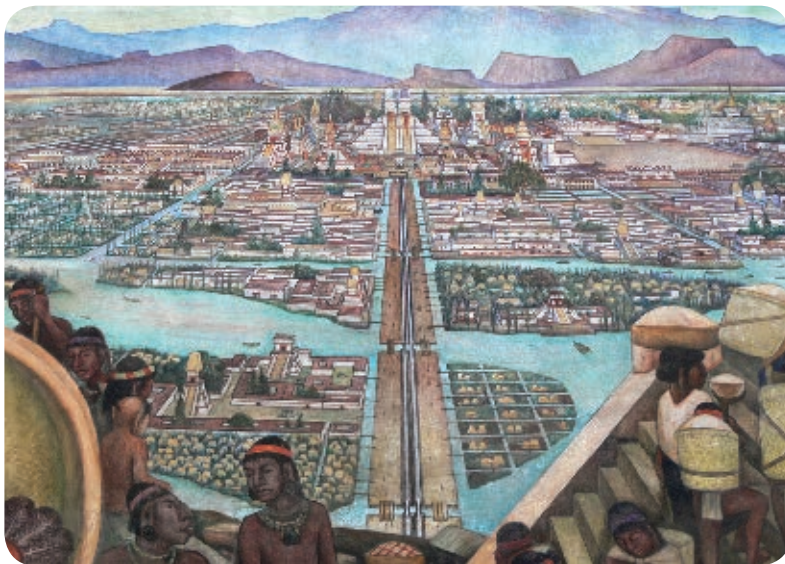
› México-Tenochtitlan a la llegada de los españoles, detalle de un mural de Diego Rivera.

El 8 de noviembre de 1519, la expedición española llegó a las montañas que rodean la Cuenca de México. Desde ahí pudieron admirar, en medio de los lagos de Texcoco y Xochimilco, una gran ciudad en un islote: México-Tenochtitlan. La transparencia del aire, el brillo del agua, el orden de las calles y los canales que atravesaban la ciudad recordaron a los españoles las ciudades más modernas de Europa.