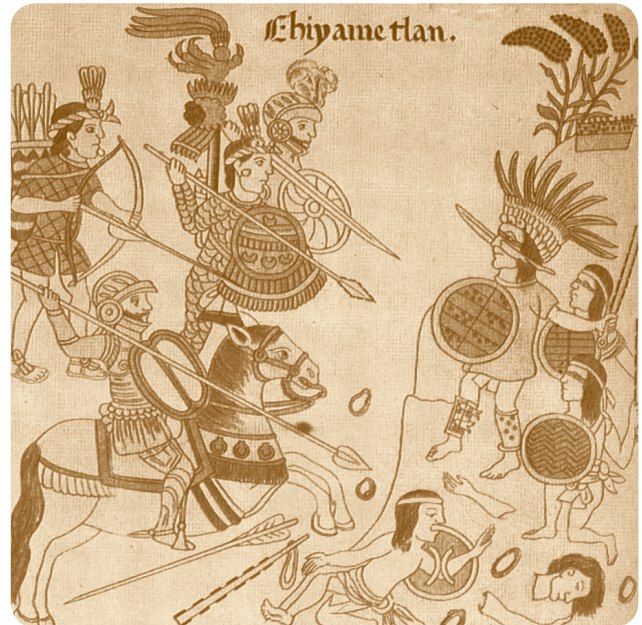
➤ Batalla entre españoles y tlaxcaltecas contra los mexicas, Lienzo de Tlaxcala .

Las batallas entre indígenas y españoles continuaron. Los españoles combatían con espadas, caballos, perros y armas de fuego. Los mexicas peleaban con lanzadardos, macanas, flechas y piedras. Se habían quedado sin gobernante, pero uno de los nobles, Cuitláhuac, tomó el lugar de Moctezuma para encabezar la lucha contra sus enemigos.