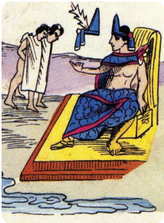
➤ Moctezuma (1466-1520), Códice Durán .