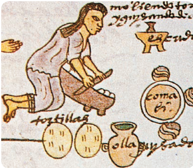
➤ Las tortillas se hacían con maíz molido en metate, como se muestra en esta imagen del Códice Mendocino .

Miles de años después, en las primeras ciudades de la cuenca (observa la línea de tiempo), las personas empezaron a especializarse en ciertas actividades. Se dividieron las obligaciones en la comunidad: algunos se dedicaban a la agricultura, otros elaboraban recipientes de barro, y otros más cocinaban alimentos y construían espacios para secar la carne y preparar las pieles de animales para vestirse. Cuando fue posible tejer fibras, como el ixtle del maguey, una planta que crecía en la Cuenca de México, empezaron a elaborar canastas y a confeccionar ropa con telas de diversos materiales.