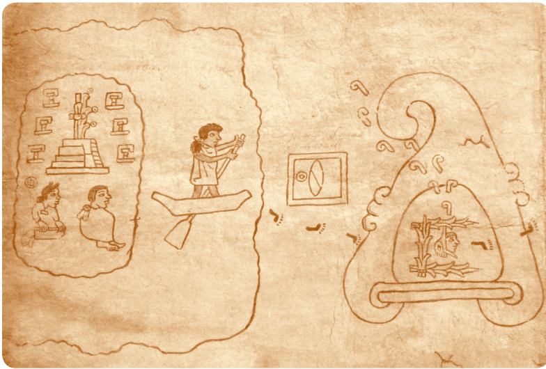
➤ La tira de la peregrinación o Códice Boturini.

A inicios del siglo XIV llegó del norte un nuevo grupo: los aztecas. Se llamaban así porque procedían de un lugar llamado Aztlán, que significa “lugar de las garzas” o “lugar de la blancura”. Los especialistas creen que estaba ubicado en el actual estado de Nayarit. También se les conoce como mexicas, que quiere decir “pueblo de Mexi” o “pueblo de Huitzilopochtli”. Observa las fechas en la línea del tiempo que está al inicio del bloque.