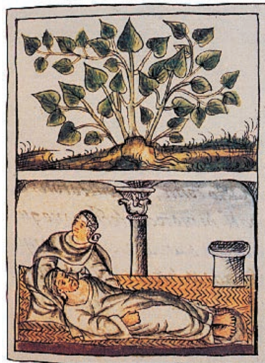
➤ El tlatlanquaye era una planta medicinal que curaba el hipo, el malestar muscular y el mal aliento, según lo dibuja el Códice Florentino .

Otras personas se especializaron en curar las enfermedades e hicieron cirugías en las que usaron plantas para reducir el dolor e hilo para coser las heridas. Además, algunos pobladores ejercían y oficiaban cultos religiosos.