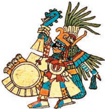
➤ Huitzilopochtli, Códice Borbónico.

Los aztecas tenían un dios llamado Huitzilopochtli que, según el mito de su creación, les ordenó marcharse de Aztlán en busca de otro lugar para vivir. Les dijo que sabrían dónde establecerse cuando encontraran un lugar en el que vieran un águila sobre un nopal devorando una serpiente. Viajaron por más de 500 años de un lado a otro buscando dicho lugar, búsqueda que relataron en un códice llamado La tira de la peregrinación .