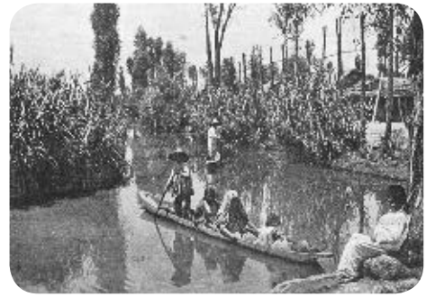
› Chinampas y canoas en Xochimilco a principios del siglo xx.

Aunque en la Ciudad de México predomina el medio urbano, el rural no ha desaparecido. Aún existe una región extensa donde se practican actividades económicas primarias. Los paisajes donde se desarrollan estas actividades también han cambiado con el paso del tiempo, principalmente por los avances tecnológicos y el tipo de herramientas que se utilizan, como los sistemas de riego, los tractores y los fertilizantes, que apoyan la labor de los agricultores. Algunas de estas actividades, por ejemplo, la agricultura y la pesca, se llevan a cabo desde la época de los mexicas.