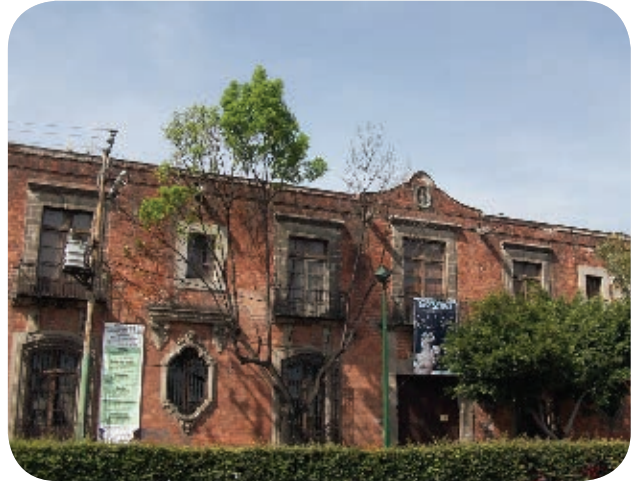
› La Casa de la Bola se construyó en Tacubaya durante el Virreinato.