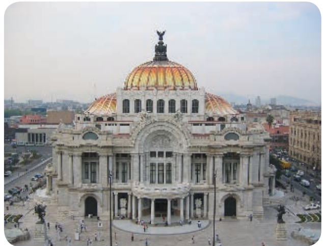
› La construcción del Palacio de Bellas Artes se inició en 1904 y se terminó en 1934 cuando se inauguró.