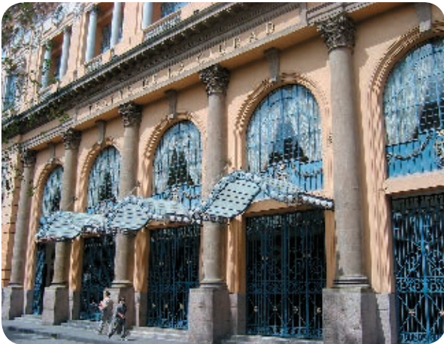
› El Teatro de la Ciudad Esperanza Iris se construyó en 1918. Es uno de los atractivos arquitectónicos del Centro Histórico de la Ciudad de México.