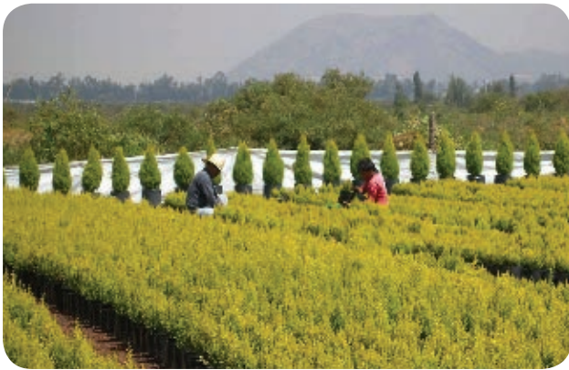
› Cultivos actuales de pinos en Xochimilco.

Algunas de las zonas que durante muchos años fueron rurales se han modificado, transformando totalmente los paisajes de nuestra entidad. A lo largo del siglo xx, con la expansión de la región urbana, grandes zonas rurales se convirtieron en calles, avenidas y zonas de edificios. Sin embargo, en algunas delegaciones, como Xochimilco, Tláhuac y Milpa Alta aún se conservan paisajes rurales, principalmente agrícolas, ya que muchas de las personas que viven ahí todavía se dedican a esta actividad.