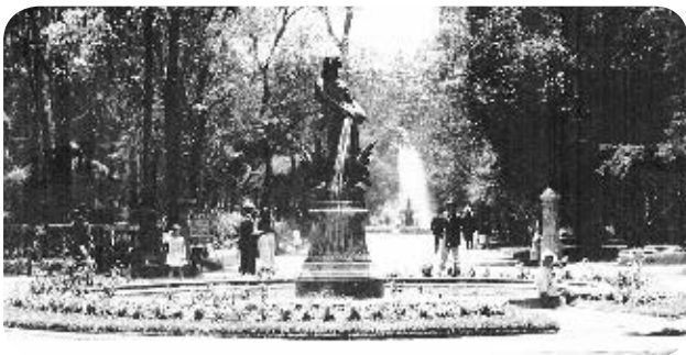
› La Alameda, a principios del siglo xx.

A lo largo del libro verás que algunas tradiciones y costumbres de los actuales habitantes de la ciudad y del campo se viven de manera parecida a como se hacía hace muchos años, como salir a pasear en familia; antes, en las plazas de México-Tenochtitlan, actualmente, en el Centro Histórico, parques, museos o en las plazas comerciales, donde hay cines y tiendas, entre otros sitios.