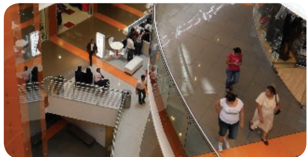
› Plaza comercial Parque Delta en la delegación Benito Juárez, 2010.