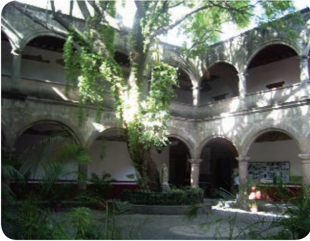
› La iglesia y el convento de Azcapotzalco se edificaron durante el siglo XVII.

Si recorres la Ciudad de México, podrás distinguir algunas construcciones muy antiguas. Por ejemplo, casi todos los edificios del Centro Histórico se construyeron durante la época virreinal, cuando este territorio era gobernado por España, como la Catedral Metropolitana y el Palacio de Minería, entre otros.