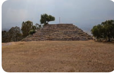
5. Edificio del Espiral, Xochitécatl. Periodo prehispánico.