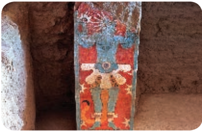
4. Hombre Escorpión, Cacaxtla. Periodo prehispánico.