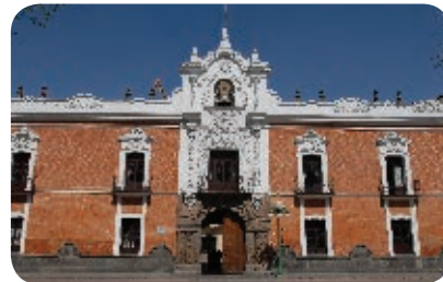
8. Palacio de Gobierno, Tlaxcala Periodo virreinal.