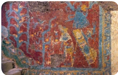
7. Pintura del Templo Rojo, Cacaxtla. Periodo prehispánico.