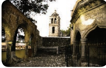
2. Capilla abierta, Tlaxcala. Periodo virreinal.