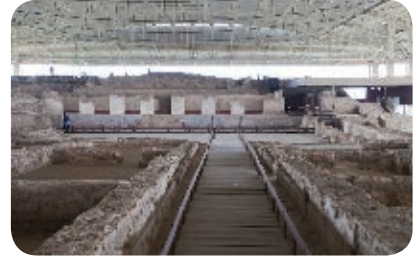
3. Zona arqueológica de Cacaxtla. Periodo prehispánico.