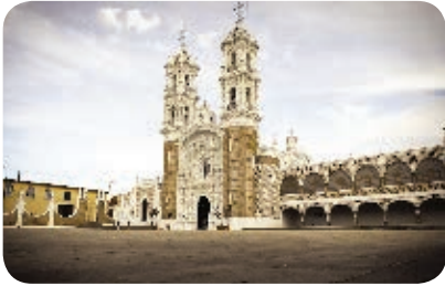
1. Catedral de Nuestra Señora de Ocotlán. Periodo virreinal.

En Tlaxcala podemos ver vestigios que dan cuenta de la vida de nuestros antepasados, seguramente has visto algunos templos, zonas arqueológicas, pinturas o edificios de diferentes épocas. Algunos ejemplos de ellos son los siguientes.