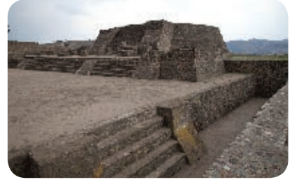
6. Pirámide de las flores. Periodo prehispánico.