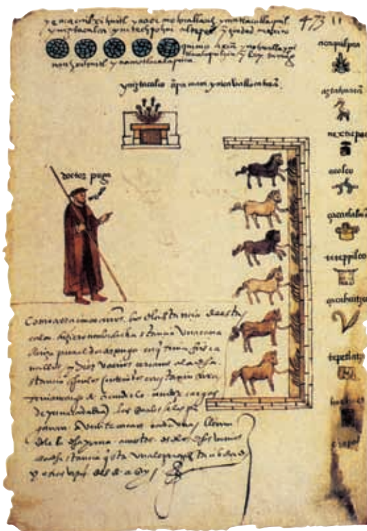
▲ Lámina que muestra los productos que recolectaban los encomenderos. Así lo dibujaron en el Códice Osuna.