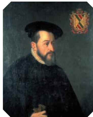
▲ Antonio de Mendoza (1490-1552) fue el primer virrey de Nueva España.

Los gobernadores administraban las provincias. Éstas se dividían en alcaldías mayores y corregimientos formados por diversos pueblos. En la base de la pirámide estaban los ayuntamientos, los cuales gobernaban las ciudades y pueblos más importantes.