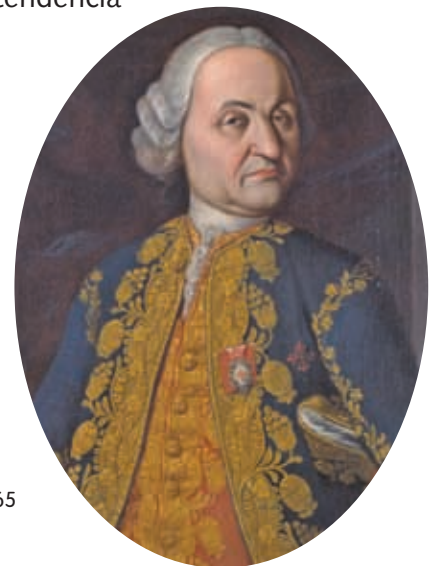
► El marqués Carlos Francisco de Croix fue virrey y gobernó Nueva España durante seis años, de 1765 a 1771. En Nuevo Santander se fundó una villa con su nombre.