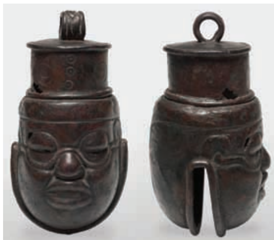
▲ Los huastecos elaboraron cascabeles con cobre, que utilizaban para algunos ritos religiosos.

En la Huasteca, los pobladores cultivaban maíz, chile, calabaza y algodón. Utilizaban instrumentos y herramientas de piedra y madera. En Vista Hermosa, los arqueólogos hallaron cascabeles, máscaras y hachas elaboradas con bronce . Cazaban venados y otros pequeños mamíferos para alimentarse, y usaban las pieles de los jaguares, las plumas de las guacamayas y las águilas para vestirse.