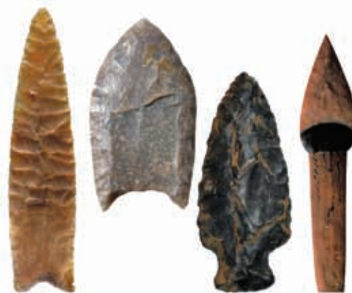
▲ Puntas de flechas utilizadas por los huastecos y algunas tribus nómadas.

Después de muchas batallas, los mexicas lograron derrotar a los huastecos. Por eso, algunos indígenas de esa región aún hablan náhuatl.