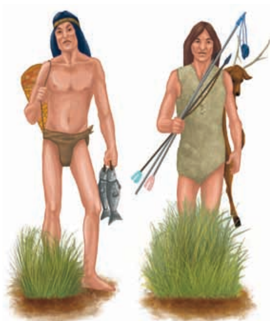
◀ Así lucían los pisonos y los janambres.

En cada una de esas regiones habitaron tribus o poblaciones distintas, cada una tenía sus propias costumbres y realizaban diferentes actividades. Por ejemplo, las tribus que habitaron en el norte, los carrizos, los tepemacas y los garzas, se dedicaron a la caza y a la pesca, ya que las extensas llanuras no eran buenas para cultivar. Eran tribus aguerridas que defendían con armas sus pertenencias; además, tenían un estilo de vida nómada; es decir, no vivían en un lugar fijo, se movían de un sitio a otro en busca de alimento.