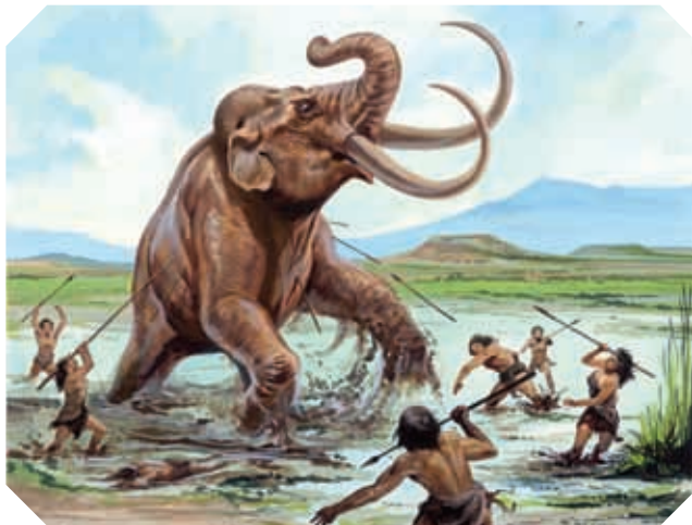
▲ Los cazadores seguían a los animales más grandes, como el mamut, hasta acorralarlos o que cayeran al agua, donde se hundían en el lodo y se facilitaba su caza.

Debido al descubrimiento de la agricultura, los pobladores comenzaron a construir aldeas, que eran un grupo de chozas situadas en lugares cercanos a los ríos, lagos y lagunas, pues con sus aguas regaban los cultivos. Para elaborar sus chozas utilizaban hojas o ramas. Colocaban las chozas en forma de círculo, así evitaban que algunos animales los atacaran.