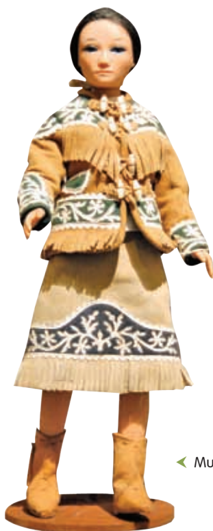
◀ Muñeca de sololoy.

Después hubo pocos cambios, se dividieron los departamentos de Tamaulipas y Matamoros, al sur y al norte, respectivamente, debido a las decisiones tomadas por Maximiliano de Habsburgo, segundo emperador de México. En el bloque 4 podrás leer más acerca de este tema.