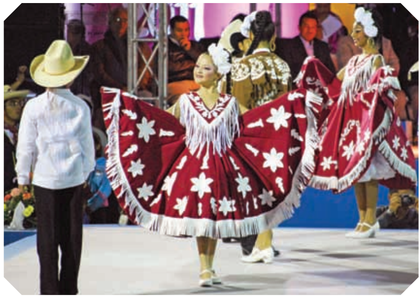
▲ El huapango o son huasteco es uno de los bailes más representativos de nuestra entidad. El hombre debe vestir pantalón, camisa blanca y cuera. La mujer utiliza una blusa y una falda del mismo material con barbas de cuero.

De acuerdo con la forma de vida, la gente desarrolla ciertas costumbres, muchas de las cuales se mantienen después de años, por ejemplo, la comida. Entre los platillos típicos del estado se pueden mencionar la carne seca, la cecina y el cabrito, preparados con recetas que vienen desde la época virreinal. Se acostumbra desayunar machaca con huevo, tamales y gorditas de azúcar. Muchos guisos se acompañan con tortillas de harina.