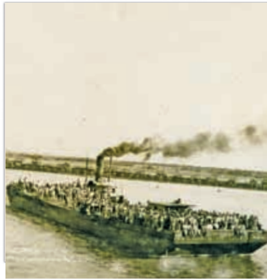
▲ Chalán de Tampico.

Comenta con tus compañeros los cambios. Escribe en tu cuaderno un texto en el que describas los más importantes que observas y explica a qué crees que se deban.