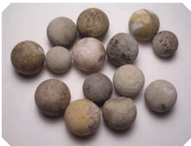
▲ Canicas de barro.