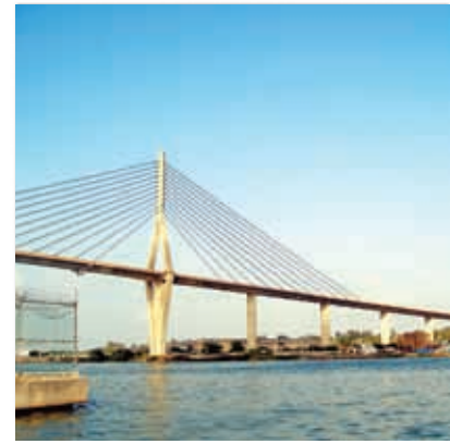
▲ Puente que conecta a Tampico con Veracruz.

A lo largo de la historia, el territorio de Tamaulipas no ha sido el mismo, incluso su nombre ha cambiado. Como estudiarás en el bloque 2, hace cientos de años nuestra entidad estuvo poblada por grupos indígenas, a este lugar llegaron los españoles, que lo nombraron costa del Seno Mexicano, ubicado en la costa del Golfo, desde el río Pánuco hasta Florida, en lo que hoy es Estados Unidos.