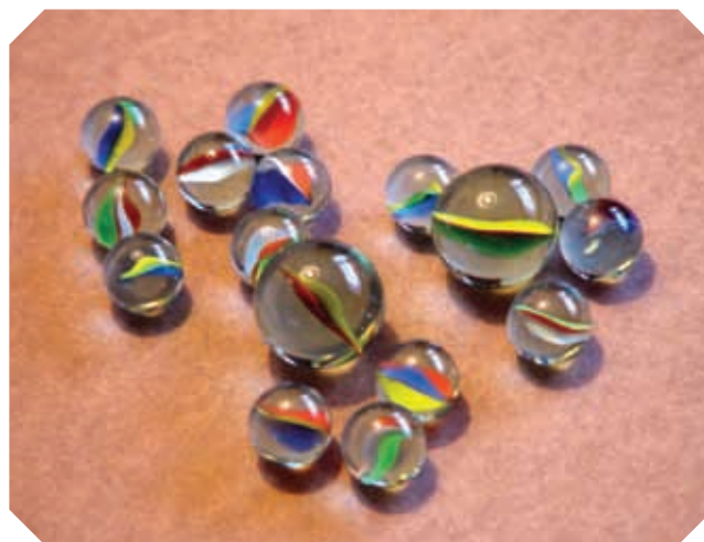
▲ Las canicas de hoy.