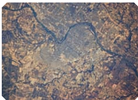
▲ Nuevo Laredo es una de las ciudades más importantes de la frontera, pues ahí se han desarrollado fuertes lazos comerciales con Laredo, Texas, formando la zona metropolitana Binacional Nuevo Laredo-Laredo.

Las actividades humanas modifican el entorno natural debido a que se utilizan los recursos naturales con el fin de elaborar los productos que las personas necesitan. Así, en el norte, en el paisaje del río Bravo, donde antes pastaban animales y vivían grupos nómadas, ahora hay tres grandes ciudades cuyos habitantes se dedican al comercio y a trabajar en las plantas maquiladoras y en los servicios. Además, este río, que antes era cruzado con balsas, ahora tiene grandes puentes por donde transitan millones de automóviles cada año. El cambio más importante ha sido su condición de frontera entre Estados Unidos y México desde 1848.