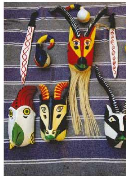
La magia y la imaginación se han transformado en una rica y variada artesanía que conjuga el uso cotidiano con el talento artístico.