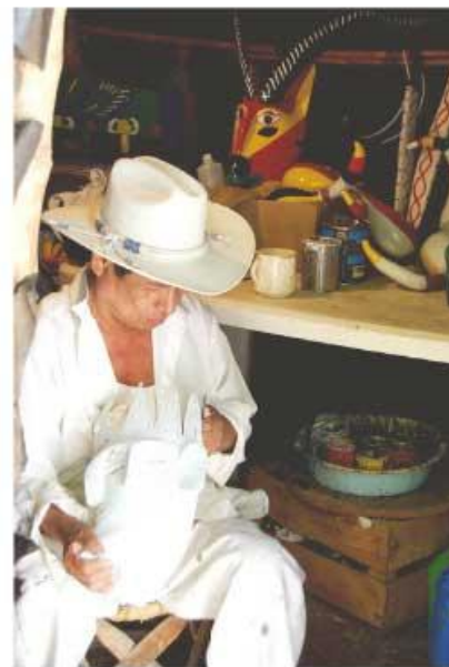
La vestimenta de calzón y camisa de manta proporciona frescura a quien la utiliza.

También se conserva la medicina herbolaria para curar una gran variedad de enfermedades. Son comunes los remedios preparados con elementos naturales, cuyas propiedades curativas en el tratamiento de dolores de cabeza, de estómago y golpes, entre otros, fueron descubiertas por los habitantes prehispánicos.