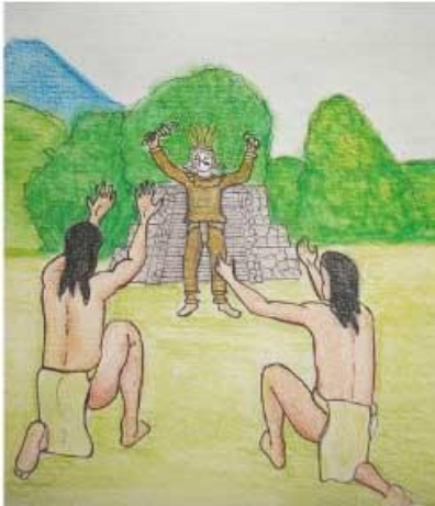
Entre los años 900 y 1154, florecieron los grupos toltecas en el territorio de Colima; eran de origen náhuatl e impusieron su avanzada cultura a los pueblos primitivos que encontraron aquí.

Uno de los mitos más conocidos de los pueblos prehispánicos es la creencia de vida después de la muerte. Ellos pensaban que sus muertos debían transportarse a otra vida, tal como habían nacido, y por eso construían sus tumbas en forma de vientre. A éstas se les da el nombre de tumbas de tiro .