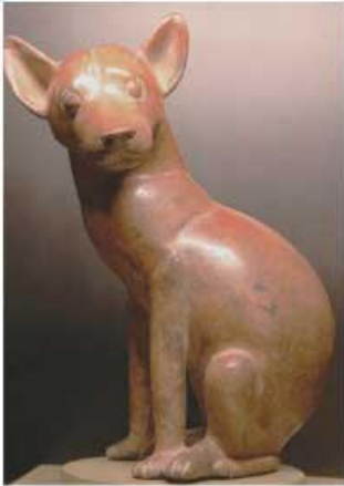
Perro. Cerámica del periodo clásico. Museo Universitario Alejandro Rangel Hidalgo.