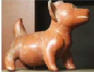
Perro cebado. Fase Capacha. Colima.