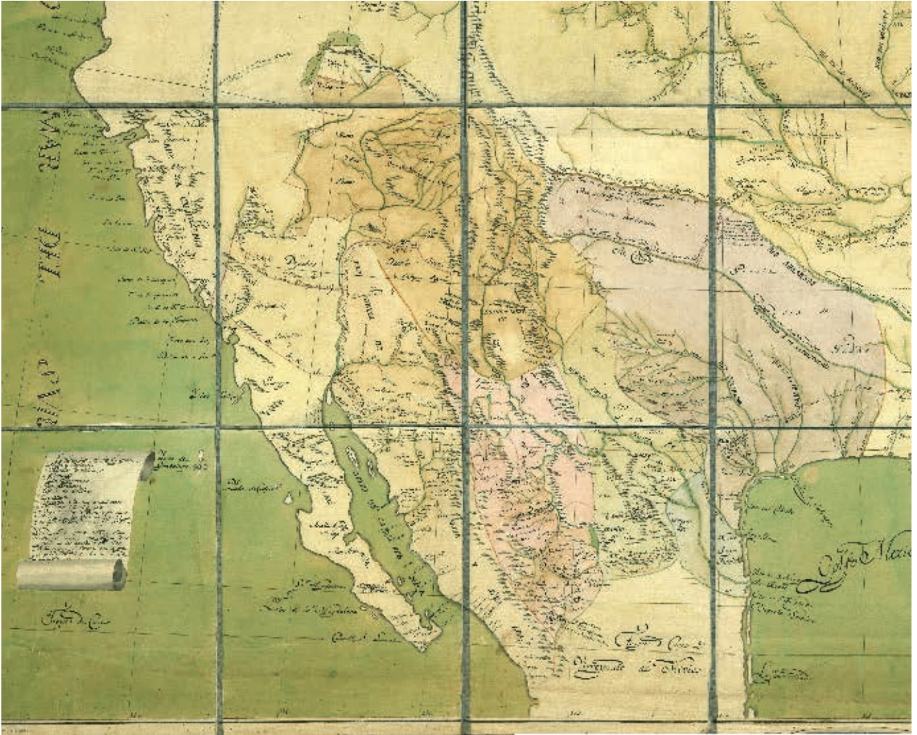
Provincias internas de Nueva España en 1817.