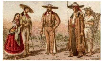
Hacendado, mayordomo, caporal.

Las comunidades indígenas conservaron algunas formas de gobierno. Una de ellas fue la de los caciques, indígenas importantes de los pueblos conquistados. Además, se nombraban gobernador, alcalde, alguacil, fiscal, temastían y sacristán. El gobernador vigilaba que se desarrollaran los trabajos encargados a los indígenas; el alcalde le ayudaba y cubría sus ausencias; el alguacil ejecutaba las órdenes del gobernador; el fiscal organizaba el culto religioso y vigilaba su cumplimiento; el temastían enseñaba doctrina a los menores y el sacristán daba mantenimiento a los templos y tocaba las campanas.