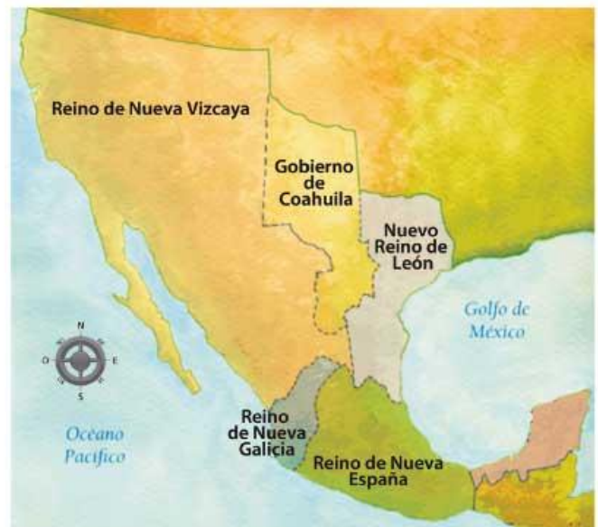
División en intendencias y provincias internas, 1786