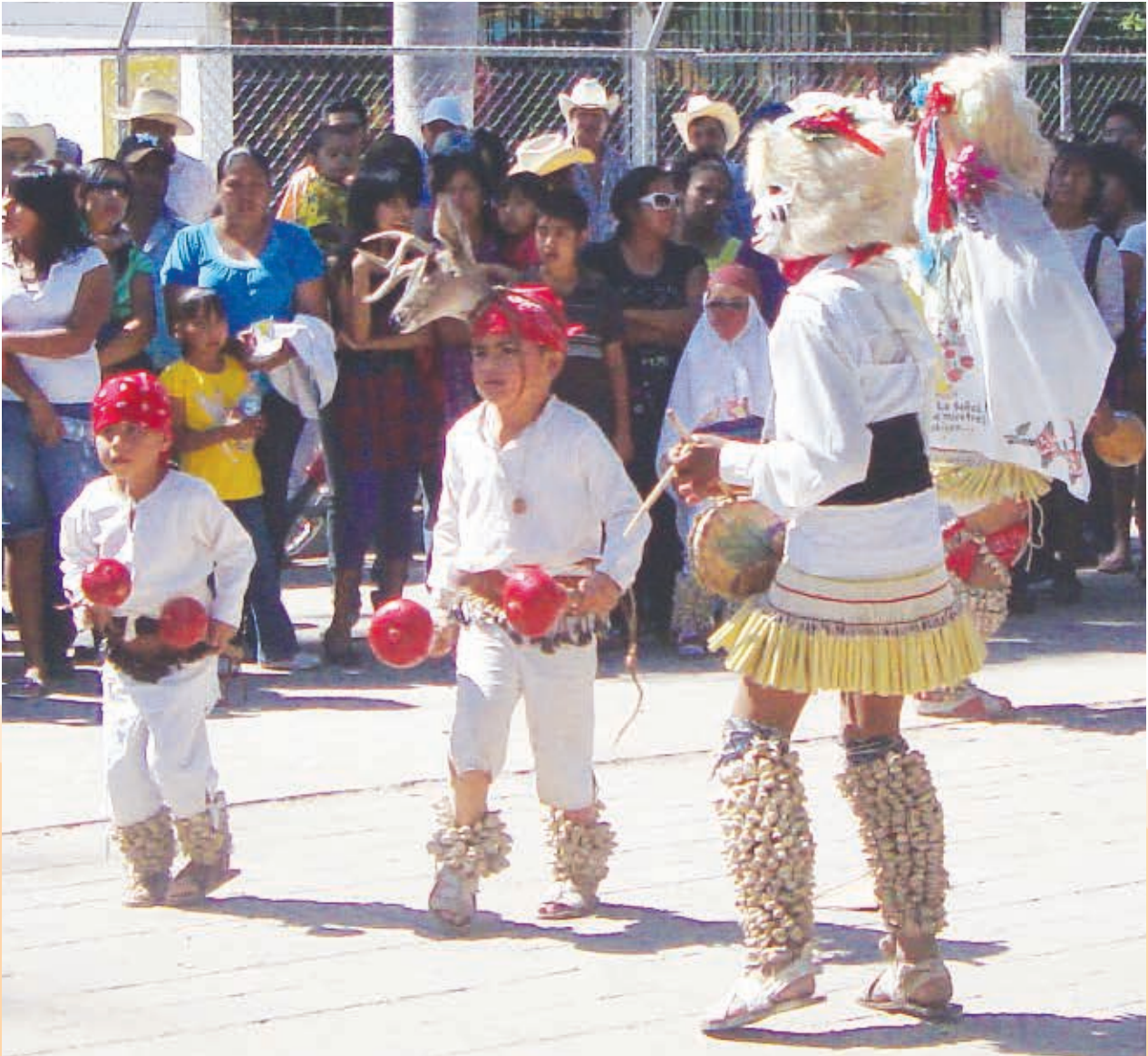
Danza del Venado, Semana Santa en Mochichahui.