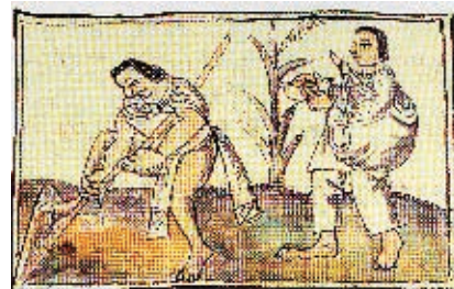
Sembradores de maíz, Códice Florentino .

Identifica aspectos del legado cultural de los grupos y culturas prehispánicas de la entidad.