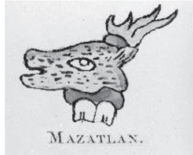
Antiguo símbolo de Mazatlán.