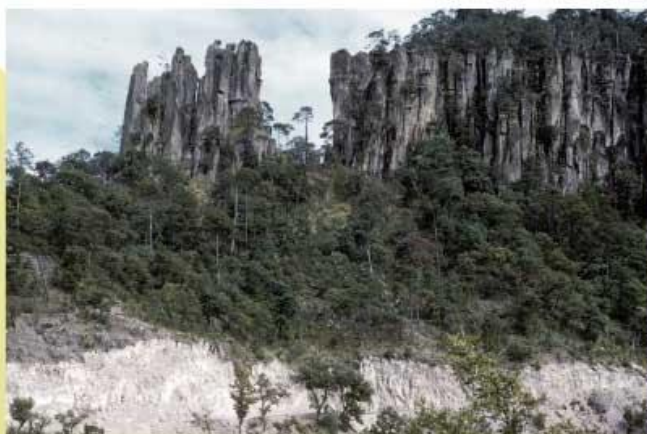
Bosque de coníferas y encinos.