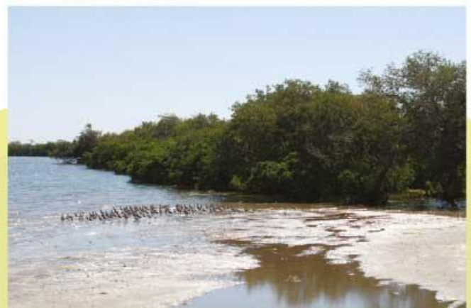
Vegetación acuática en Chametla.