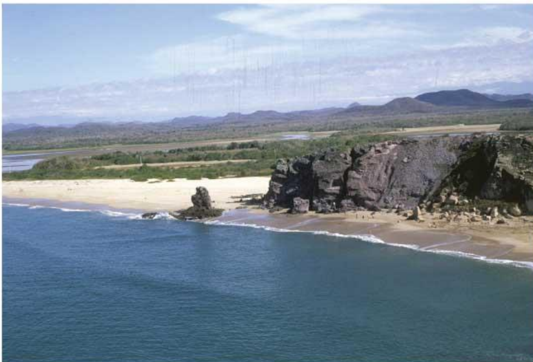
Costa de Mazatlán.

Tenemos los puertos de Topolobampo y Mazatlán, lugares que son punto de enlace para trasladar mercancías y personas entre nuestro estado y Baja California Sur, además de recibir y enviar a otras partes del país y del mundo diversos productos. La actividad pesquera ha contribuido al desarrollo de la industria de enlatados de varios productos marinos. Además, Mazatlán ha desarrollado una importante industria turística.