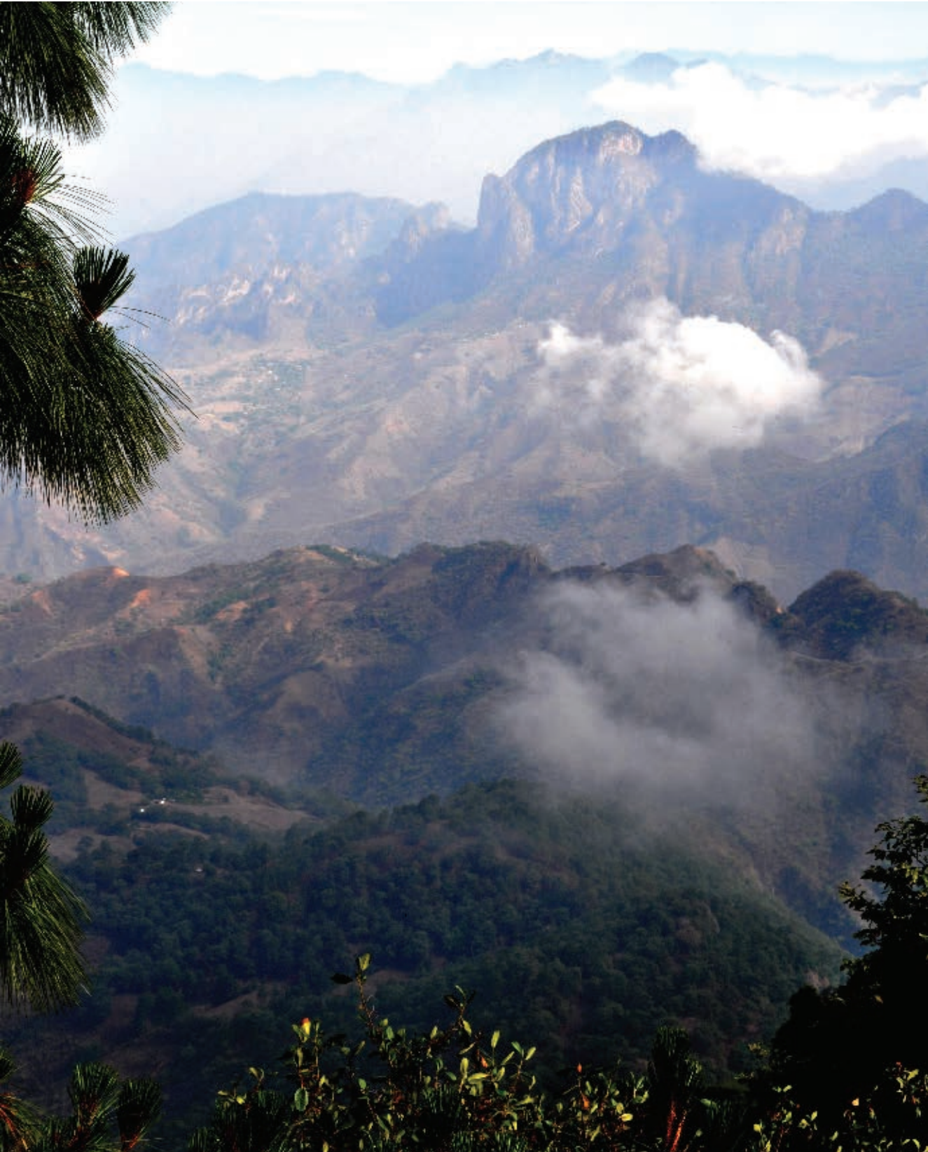
Sierra Madre Occidental.