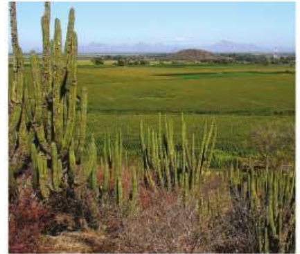
Matorral en Mochichahui.