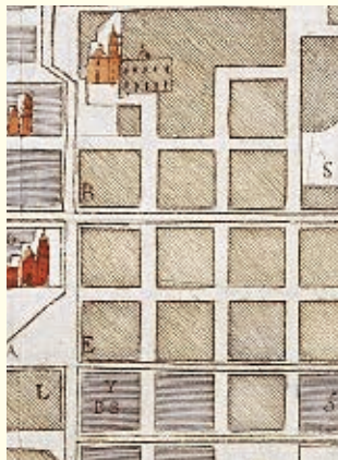
► Lo que hoy llamamos Centro histórico de la ciudad de San Luis Potosí corresponde al antiguo pueblo español de San Luis Minas del Potosí, fundado en 1592. Durante el Virreinato, los siete barrios que también formaban la ciudad fueron pueblos de indígenas.

En la región Media y en la Huasteca se introdujo principalmente el ganado bovino. En estas zonas también se criaban mulas, animales de carga que por mucho tiempo fueron el principal medio para transportar mercancías.