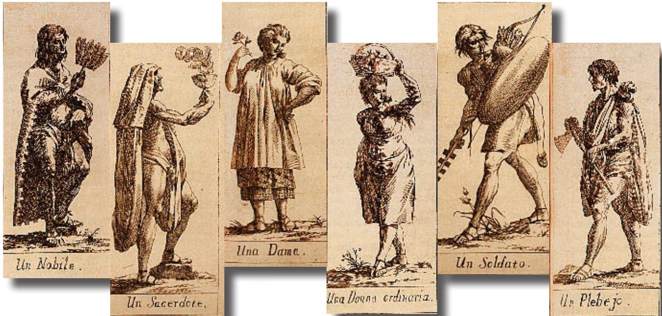
► Trajes mexicanos tal como aparecen en La historia antigua de México , de Francisco Javier Clavijero (1780).