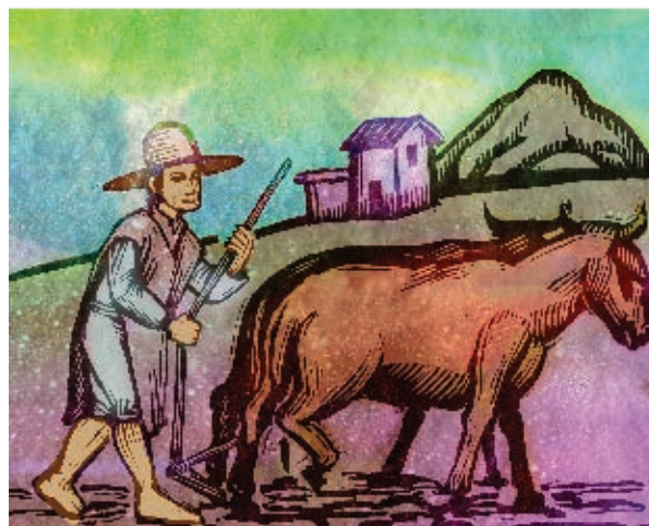
▶ Arado de la tierra.