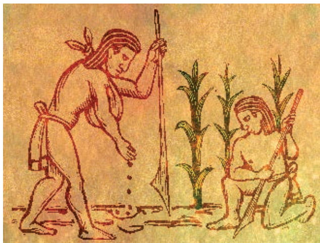
▶ Siembra de maíz.