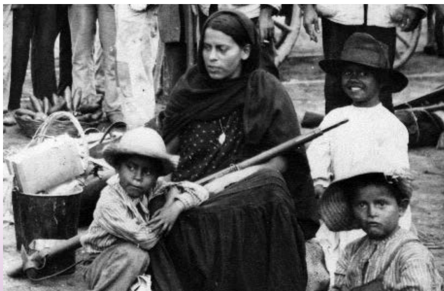
Durante la Revolución Mexicana las mujeres y los niños participaron de distintas maneras.

Aunque durante el movimiento revolucionario hubo destrucción, hambre, enfermedades, muerte y sufrimiento, el pueblo mexicano triunfó y pudo iniciar la construcción de un nuevo país.