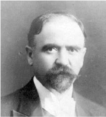
Francisco I. Madero, héroe nacional que luchó por lograr la democracia en nuestro país.

Iluso. Que está engañado con una ilusión o que tiende a engañarse con facilidad.