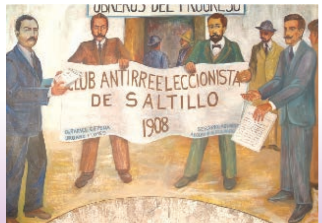
Grupos opositores a la reelección de Díaz.

La vida de artesanos y campesinos dependía de la avaricia de comerciantes y hacendados, quienes pagaban muy poco por los productos.