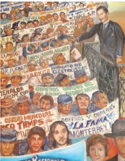
Campesinos y obreros participaron en el desarrollo del país.