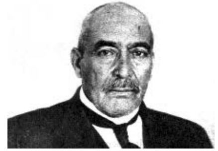
Victoriano Huerta, presidente de la República de 1913 a 1914.

A través de la lucha habían surgido muchas inquietudes y demandas sociales que debían ser solucionadas, por lo que Venustiano Carranza expidió un decreto en el mes de septiembre de 1916 en el que convocaba a formar un congreso constituyente que reformara la Constitución de 1857. En el teatro de la ciudad de Querétaro se reunieron 182 diputados que estudiaron y discutieron cómo debían ser las nuevas leyes que guiarían la vida de la nación.