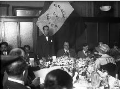
Reunión de la Confederación Regional Obrera Mexicana (CROM).

El 1 de mayo de 1918 es muy significativo, ya que se reunieron en Saltillo delegados obreros de todo el país; coordinados por Luis M. Morones, crearon la Confederación Regional Obrera Mexicana (CROM), que tuvo un papel muy importante en la vida política nacional durante varias décadas.