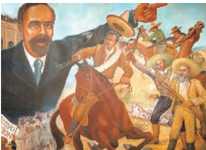
Madero recibió el apoyo de los mexicanos en todo el país.

el 25 de junio de 1908 en Viesca, pero fue reprimido por las fuerzas militares de Díaz.