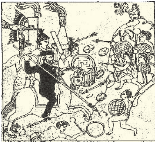
► Lienzo que representa la toma de Tenochtitlan.

La vida de los antiguos mexicanos cambió drásticamente con la llegada de los españoles. En pocos años, los territorios habitados por diversos grupos de indígenas fueron conquistados porque el dominio español se impuso por medio de la guerra y de alianzas. Los españoles conquistaron primero los pueblos sedentarios cercanos a Tenochtitlan, donde hoy está la ciudad de México. Después, se movilizaron hacia el norte, donde les fue muy difícil someter a los chichimecas.