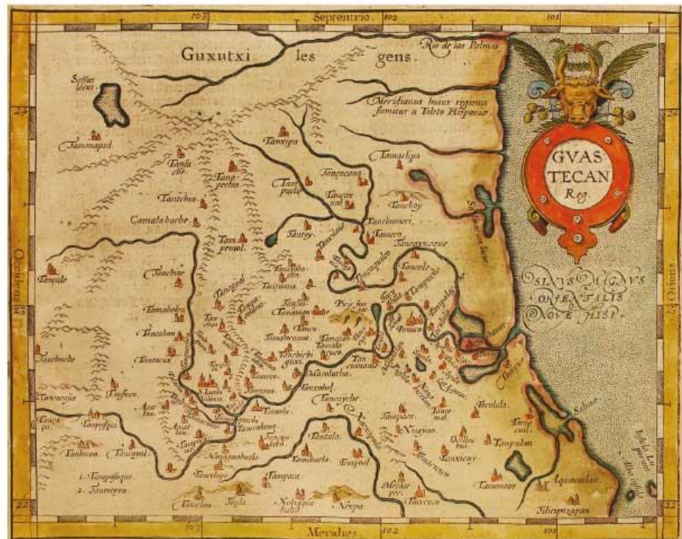
► Mapa de la región Huasteca (1584), Abraham Ortelius, Biblioteca del Congreso de Estados Unidos.

Vestigio. Ruina, señal o resto que queda de algo.