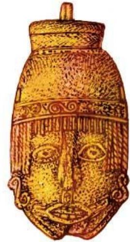
► Cascabel metálico encontrado en Tamtoc.

En la Huasteca se han encontrado restos de edificios, monumentos y trazos de ciudades que nos indican cómo vivieron los antiguos pobladores de la región. Estos vestigios arqueológicos nos ayudan a entender la historia de un territorio que hoy forma parte de nuestro estado y de nuestro país. Huaxcamá, El Cuiche, Agua Nueva, Tamante y Platanito son sitios con restos de ciudades, así como Tamohí y Tamtoc.