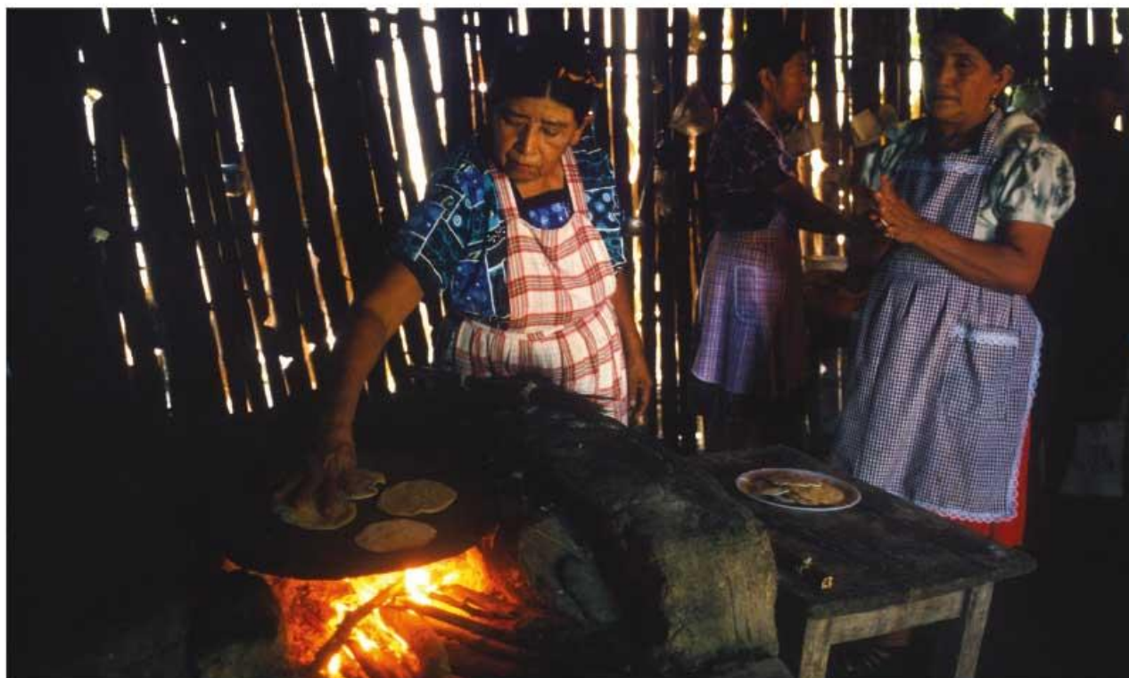
► Mujeres tének.