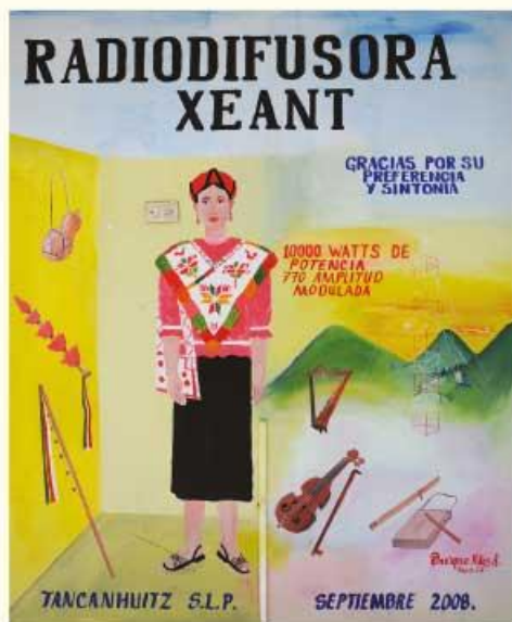
► Promocional de la radiodifusora.