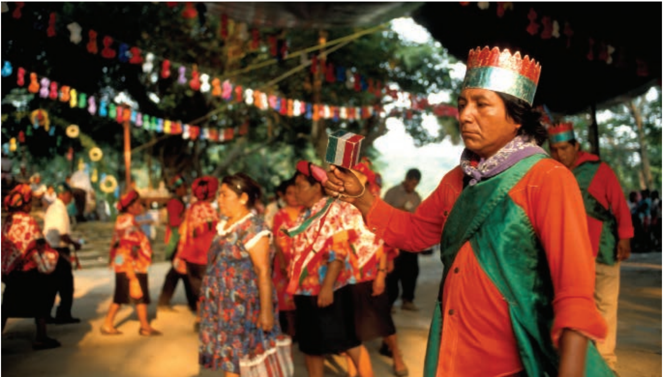
► Tsacamsón, danza tének asociada a la siembra y la cosecha del maíz, en el municipio de Tancanhuitz.

Además de los edificios, las esculturas y otros vestigios, los pueblos prehispánicos tienen descendientes, quienes hoy en día mantienen vivas algunas prácticas antiguas, ya sea porque guardan memoria de ellas o porque las recrean y transforman cotidianamente. Por ejemplo, los descendientes de pames y huastecos se comunican en sus propias lenguas y hacen de ellas un medio para la creación cultural.