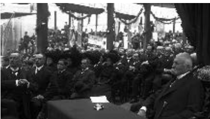
Porfirio Díaz fue presidente de la república mexicana por un periodo de 34 años.