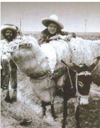
Campesinos transportando productos con métodos tradicionales.

La economía creció gracias al ferrocarril, el telégrafo, el teléfono, la electricidad, el cinematógrafo, el automóvil y la creación de escuelas. Hubo un gran auge del teatro, el establecimiento de imprentas, la publicación de más periódicos y folletos, la instalación de agua entubada y drenaje en las localidades más grandes, la aparición de patrones de cultura europea y el desarrollo industrial, minero y comercial.