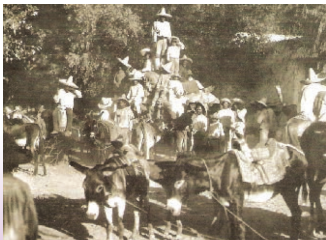
En las haciendas los peones recibían tratos injustos.

En las principales ciudades de Coahuila de Zaragoza: Saltillo, Parras, Monclova, Torreón y Ciudad Porfirio Díaz (Piedras Negras), hubo un crecimiento acelerado del número de habitantes, que eran empleados en condiciones de miseria en minas, haciendas y obrajes .