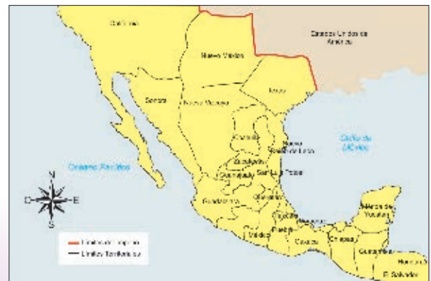
Coahuila y Texas formaron un solo estado a partir del Imperio de Iturbide, cuando el territorio de México alcanzó su mayor extensión.