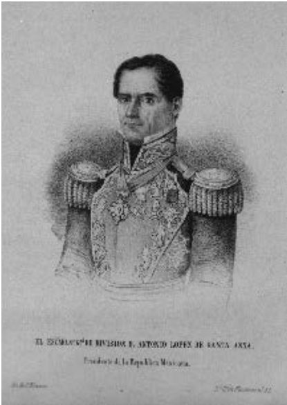
General Antonio López de Santa Anna.

A la mitad del camino entre Buenavista y La Encantada, cerca de Saltillo, se encuentra un lugar llamado La Angostura, que tiene colinas y cerros que son parte de la Sierra Madre Oriental y donde nace un arroyo. En este desfiladero, los días 22 y 23 de febrero de 1847 se desarrolló la batalla que los estadounidenses llaman de Buenavista y los mexicanos de La Angostura. Ahí, con un ejército carente de suficientes municiones, con armas en mal estado y sin recursos para el pago de su alimentación, el general Antonio López de Santa Anna y sus subalternos decidieron salir a enfrentarse con los estadounidenses.