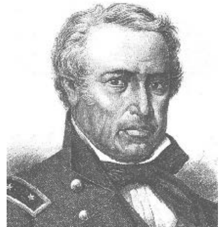
General Zachary Taylor, jefe de las tropas estadounidenses.

Otros, teniendo como jefe al general Zachary Taylor, entraron por Matamoros y avanzaron hasta Monterrey, que ocuparon, y llegaron a Saltillo el 16 de noviembre del mismo año. El 15 de diciembre se apoderaron de Parras.