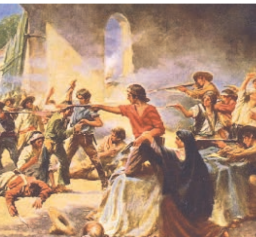
Texas decide separarse de Coahuila de Zaragoza. Batalla de El Álamo .

Anglosajón. Persona de origen británico que procede de pueblos con lengua y civilización inglesas.