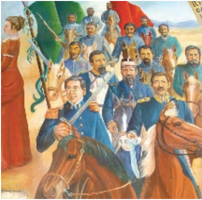
Ignacio Zaragoza enfrenta y vence a las tropas francesas en 1862.

Anexión. Unir una cosa a otra con dependencia de ella, especialmente un territorio o un estado a otro.