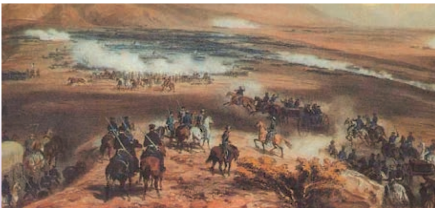
La Batalla de La Angostura de 1847.