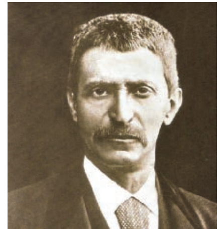
Victoriano Cepeda, gobernador de Coahuila de Zaragoza en distintos periodos del siglo XIX.

A partir de esta etapa Coahuila de Zaragoza tuvo un crecimiento en el número de habitantes, que se establecieron más en las fértiles tierras de la Comarca Lagunera y algunas haciendas del norte, favorecido por el reparto de tierras a los soldados que militaron en el ejército republicano y por el desarrollo de los ferrocarriles, que hicieron posible la comunicación entre villas y pueblos.