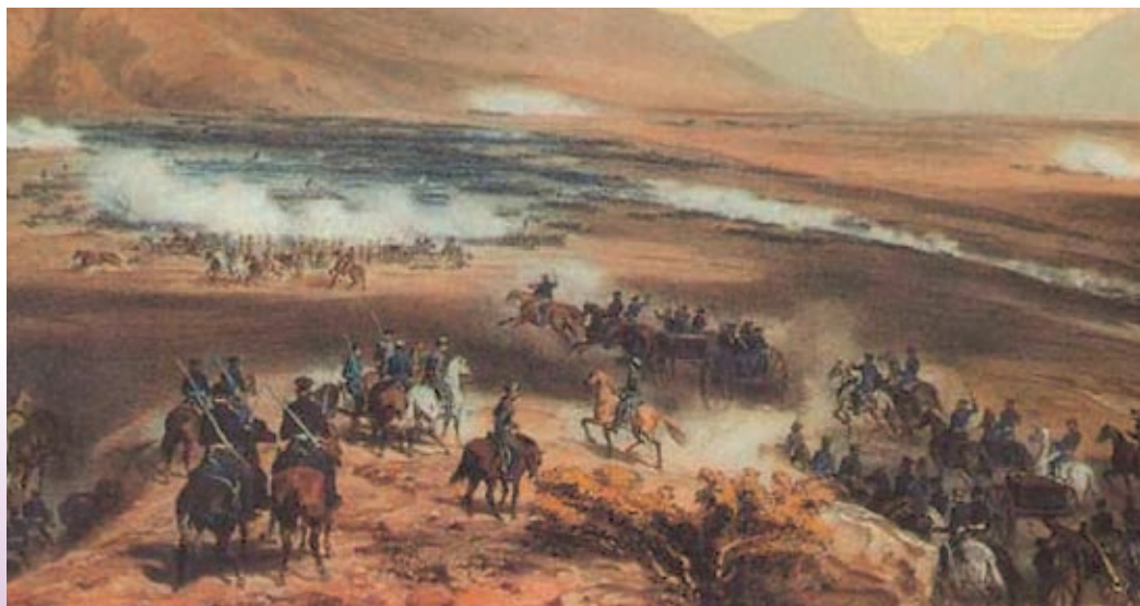
Batalla de la Angostura entre el ejército mexicano y tropas estadounidenses, en febrero de 1847.