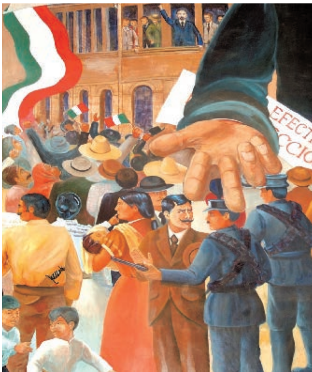
Recibimiento de Madero por el pueblo de Saltillo, quien lo aclamó a su llegada a la plaza principal.

Ordenarás cronológicamente acontecimientos que transformaron a Coahuila de Zaragoza, desde el México independiente hasta la Revolución Mexicana.