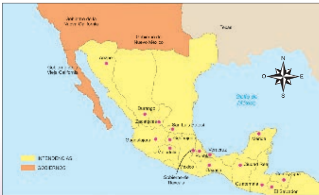
División política de México entre 1778 y 1821, que incluía a Coahuila, Texas, Nuevo León y Tamaulipas como parte de la intendencia de San Luis Potosí.

En los territorios del norte la vida fue azarosa y peligrosa; las poblaciones se encontraban muy alejadas unas de otras y sus habitantes vivían bajo la amenaza de ser atacados en cualquier momento por indígenas comanches, apaches y otros grupos.