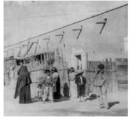
Habitantes de Torreón.

Después de la invasión y la pérdida de la mitad del territorio nacional, Antonio López de Santa Anna nuevamente llegó a la presidencia de la República, y durante muchos años cometió abusos y arbitrariedades en contra del pueblo.