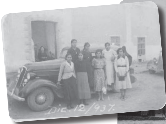
► Habitantes del municipio de Villa de Guadalupe.