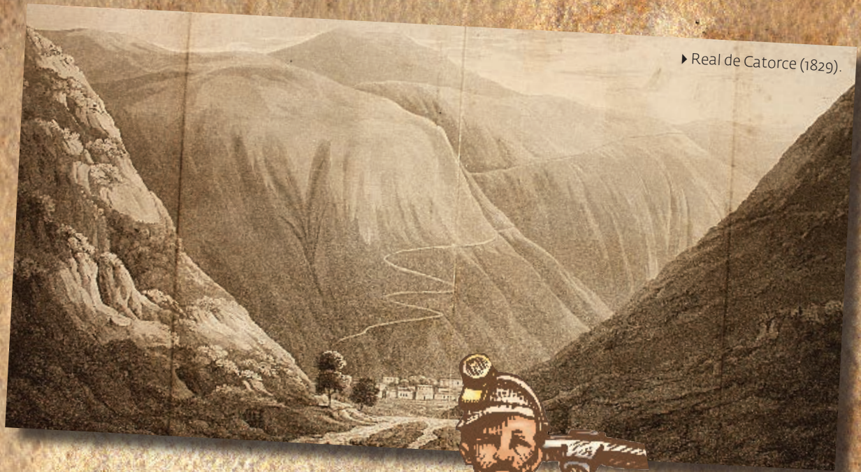
► Real de Catorce (1829).