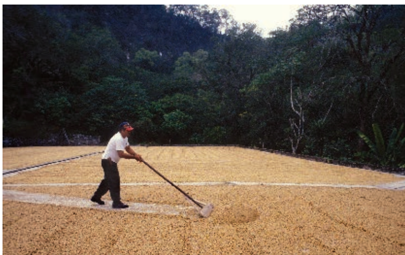
► Secado de los granos de café, en Xilitla, localizado en la región Huasteca.