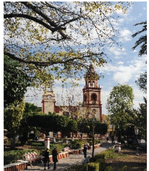
► Plaza de Cerritos, en la región Media del estado.

Las regiones económicas de nuestro estado se definen por las actividades productivas y las características sociales de la población. De igual manera, se toman en cuenta las características naturales del territorio, ya que esto indica cuáles son algunos de los recursos que se han utilizado para su crecimiento económico.