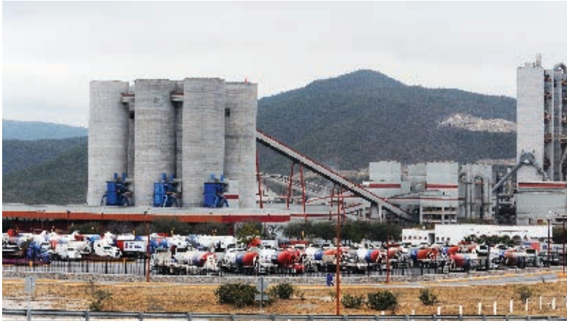
► Vista de una fábrica de cemento de reciente creación localizada en el municipio de Cerritos.

En la región Altiplano son importantes varias actividades. Los municipios Charcas, Guadalcázar y Real de Catorce destacan por la minería, sobre todo, la extracción de plata, oro, zinc, mármol y calizas. También es importante el tallado de fibra de ixtle de lechuguilla, la cría de cabras y ovejas y el cultivo de maíz, frijol y hortalizas; estas últimas en espacios regados con aguas subterráneas en sitios como Villa de Arista y El Barril. Matehuala es la segunda ciudad en importancia industrial del estado.