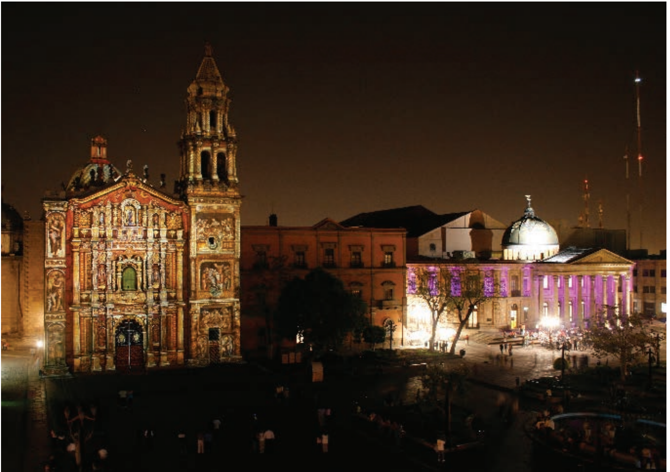
► Vista nocturna del Templo del Carmen y del Teatro de la Paz, en la ciudad de San Luis Potosí.

En México se considera población urbana a quienes viven en localidades formadas por más de 2500 personas. Quienes viven en localidades de menos habitantes son clasificados como población rural.