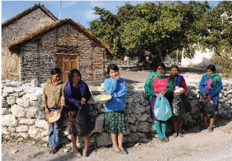
► Mujeres y niñas artesanas de Santa María Acapulco, de la etnia x'ui', en el municipio de Santa Catarina.