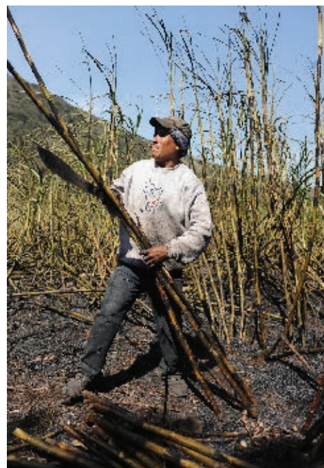
► Corte de caña en la región de la Planicie del Golfo, en algunos municipios de la Huasteca Potosina.