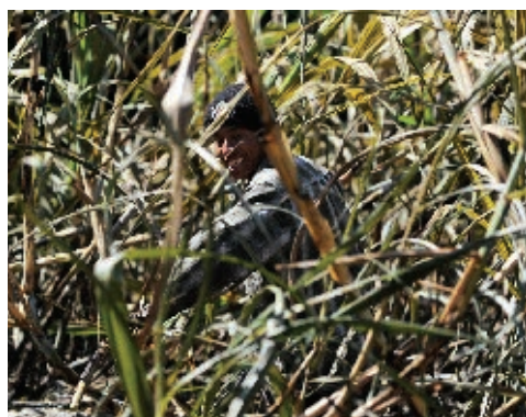
► Cultivo de caña.

En San Luis Potosí, las principales actividades agrícolas son el cultivo de caña de azúcar, maíz, naranja y soya. En la industria minera, la producción más importante es la de zinc, cobre y fluorita, de la que nuestro estado es el segundo productor mundial. La industria de alimentos y la de fabricación de automóviles son también importantes. Un gran número de personas se dedica al comercio y a ofrecer servicios.