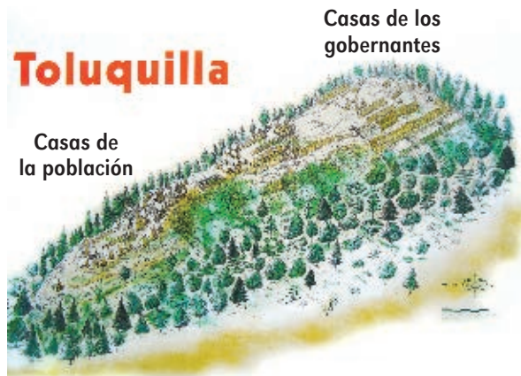
Croquis de la zona arqueológica de Toluquilla.

Representen y ubiquen las casas de acuerdo con las actividades de los diferentes miembros de esos pueblos.