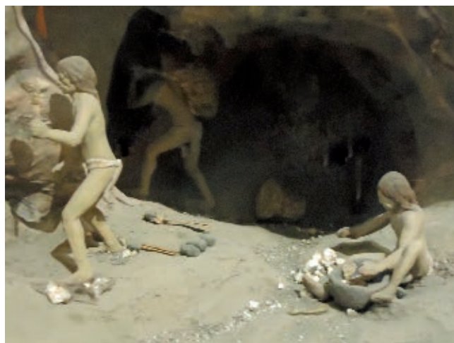
Representación de mineros chichimecas extrayendo cinabrio, mineral del que se obtiene el mercurio. Museo Regional de Querétaro.

¿Qué diferencias encuentras entre la forma de vida de los chichimecas que vivían en Aridoamérica y la de los pueblos mesoamericanos de Querétaro?