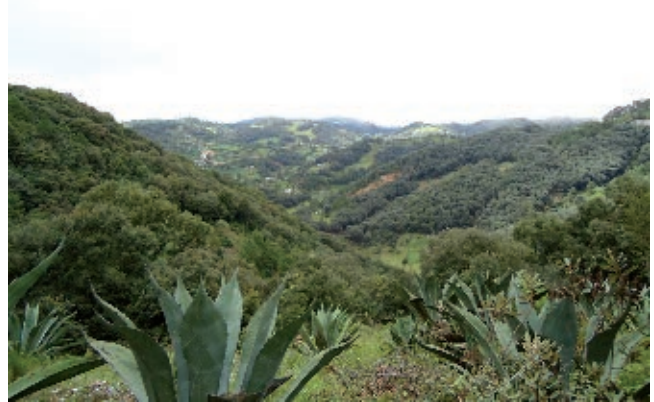
Terreno formado por montañas y cañadas.

tarascos, son uno de estos grupos, y fueron quienes nombraron este territorio como Queréndaro , que significa “lugar de peñas”. Los otomíes lo llamaron y lo siguen llamando Nda-Maxei , que significa “lugar de juego de pelota”. Los mexicas, quienes controlaron lo que hoy es nuestra entidad, lo llamaron Tlachco , palabra que en lengua náhuatl significa “lugar del juego de pelota”. Lo nombraron así porque el terreno que ocuparon los primeros pobladores de la actual ciudad de Santiago de Querétaro, o simplemente Querétaro, tiene la forma de las construcciones para el juego de pelota. Los españoles, que llegaron a nuestra entidad en 1529, al escuchar a los purépechas que aquí vivían, adoptaron el nombre que le habían dado a este territorio y comenzaron a llamarlo Querétaro.