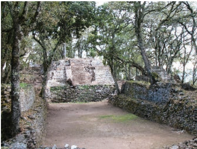
Juego de pelota prehispánico.

En México convive gente de distinto origen. Hay grupos étnicos que han vivido aquí desde hace mucho tiempo. Los purépechas, también llamados