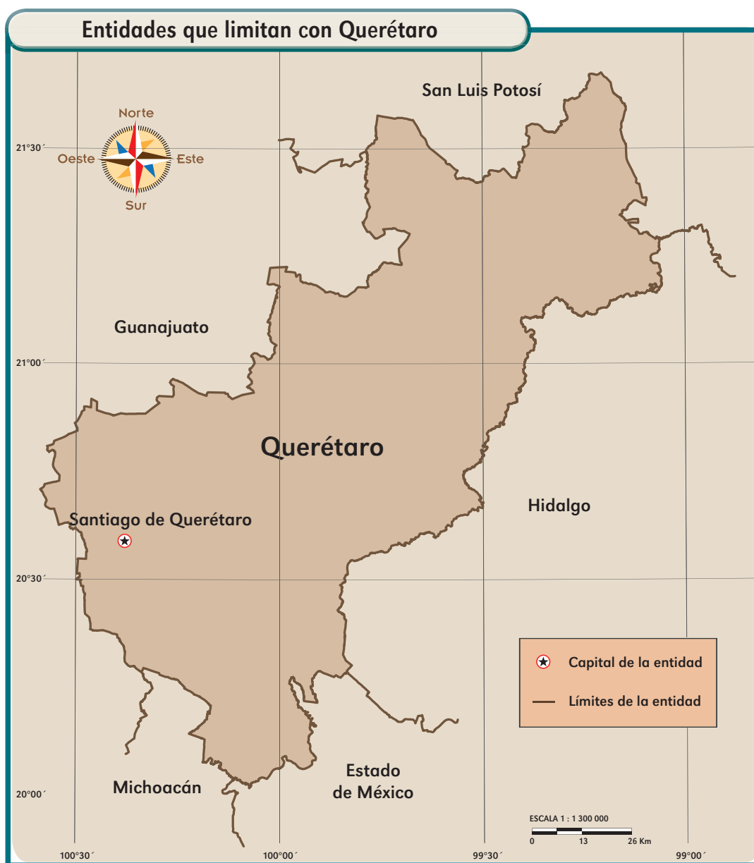
Fecha de elaboración: septiembre de 2010.

Observa la rosa de los vientos del mapa, identifica las entidades que limitan con Querétaro y escribe sus nombres en las líneas correspondientes.