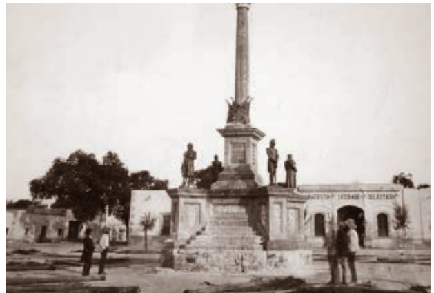
Primer edificio del Instituto Científico y Literario que albergó a la Escuela Normal del estado.

A finales del siglo xix y principios del xx, se crearon la Escuela de Artes y Oficios, la Escuela Industrial para Señoritas, la Escuela Particular de Agricultura Hermanos Escobar y la Escuela Normal del Estado, donde los jóvenes estudiaban un oficio o carrera para trabajar.