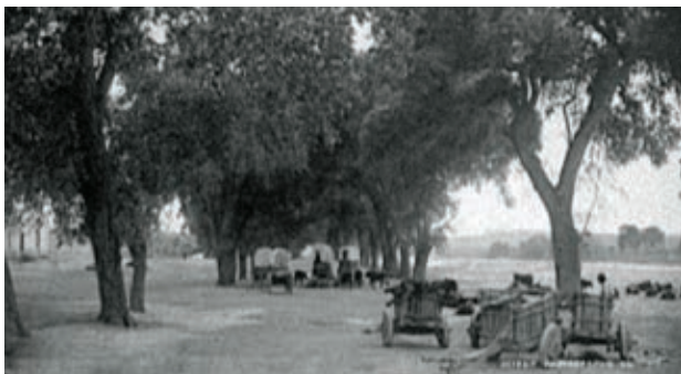
Transporte de mercancías en carretas.