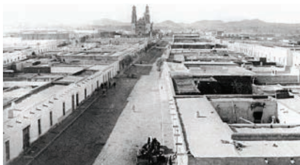
Casas y carruajes en la ciudad de Chihuahua.