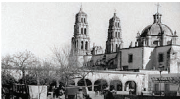
Mesón detrás de la Catedral de Chihuahua.