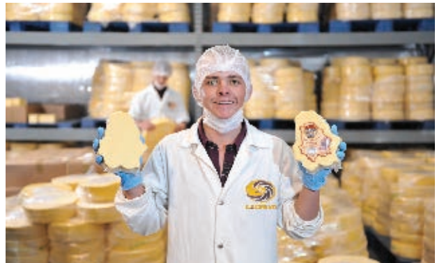
Comercio en el municipio de Cuauhtémoc.