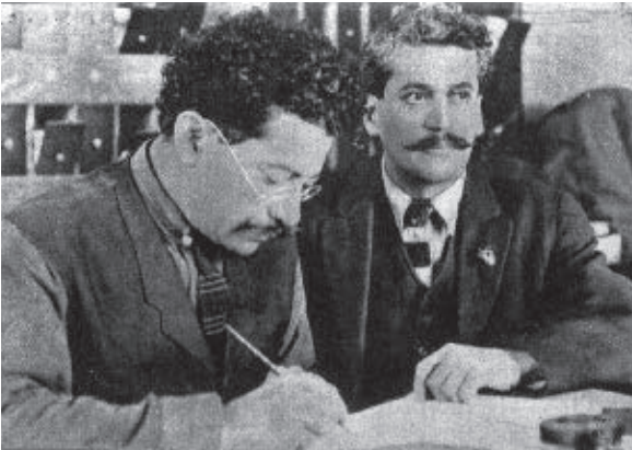
Ricardo y Enrique Flores Magón.

Durante los inicios del siglo xx, las noticias de los acontecimientos en el estado se daban a conocer en periódicos como El Chihuahuense , El Correo de Chihuahua , El Grito del Pueblo , Sufragio Efectivo y La Carreta . Este medio de comunicación contribuyó a que las ideas revolucionarias se difundieran rápidamente entre la población.