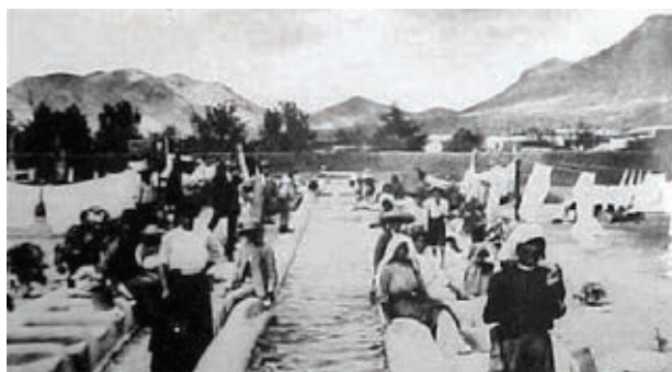
Lavanderas en el acueducto.