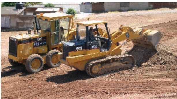
Construcción de caminos en el municipio de Carichí.