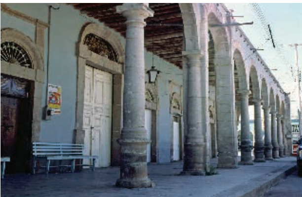
Edificio en Valle de Allende.

Vamos a elaborar una maqueta de algún edificio, hacienda o casa del lugar donde vives, de tu municipio o entidad, que haya sido construido durante el Porfiriato. Puedes consultar en internet las páginas electrónicas < www.inah.gob.mx > y < www.chihuahua.gob.mx >.