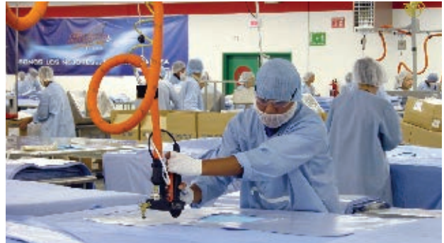
Industria en el municipio de Juárez.

➡ Comenta con tus compañeros cuáles actividades realizaba la población a inicios del siglo xx y cuáles realiza en la actualidad. Escribe tus conclusiones en el cuaderno en un texto titulado "Cambios de la vida cotidiana del campo y la ciudad". Considera las formas de vida en el medio rural y urbano, el desarrollo de las actividades, la comunicación y el transporte.