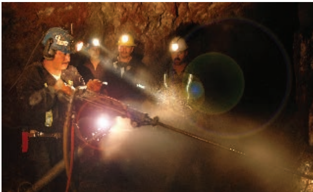
Minería en el municipio de Ocampo.

Observa las fotografías de la página anterior y compáralas con las actividades que la población realiza en la actualidad.