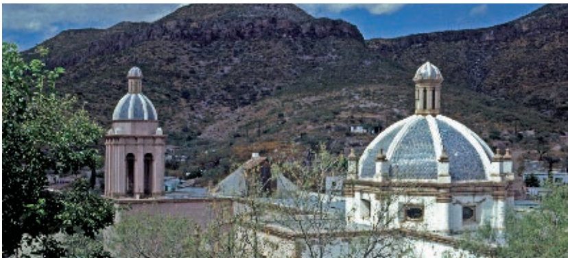
Santa Eulalia, municipio de Aquiles Serdán.

El acueducto servía para hacer llegar el agua a diversos lugares. Estaba construido con arcos de cantera.