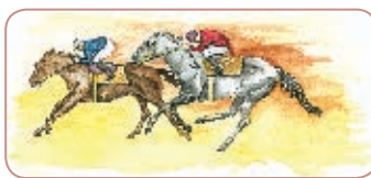
Carrera de caballos