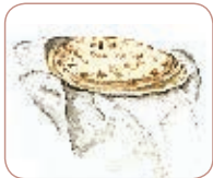
Tortillas de harina