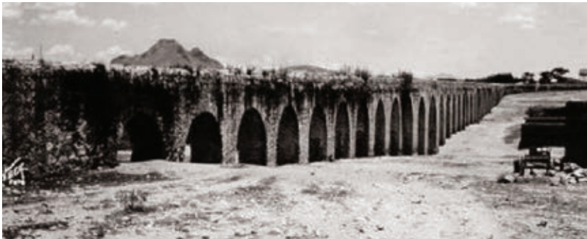
Acueducto de la ciudad de Chihuahua.

Delicias, Jiménez, Camargo, Chihuahua y Juárez son algunas de las ciudades que tienen este trazo virreinal en la organización urbana y que es parte del legado cultural.