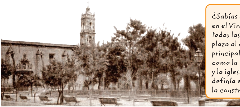
Hidalgo del Parral.

¿Sabías que la arquitectura en el Virreinato imponía en todas las poblaciones una plaza al centro y alrededor los principales edificios públicos, como la Presidencia Municipal y la iglesia?; a partir de ahí se definía el trazo de las calles y la construcción de las casas.