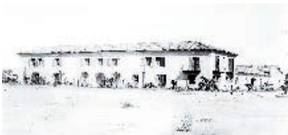
Colorado River Land Company, ca., 1930.

El Instituto Nacional de Antropología e Historia (INAH) es responsable de los edificios antiguos cuando cumplen cien años y son considerados parte de la historia del país; como la mayoría de las ciudades de Baja California apenas rebasan los cien años, sus edificios no están bajo la responsabilidad del INAH.