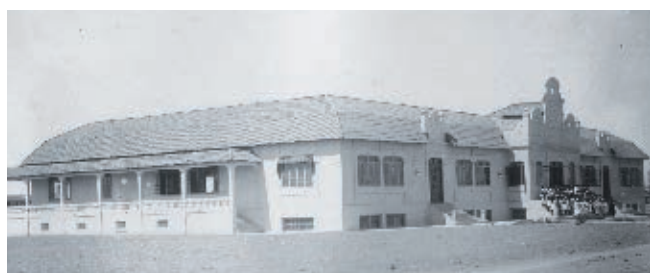
Escuela Primaria Leona Vicario, ca., 1926.