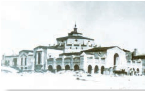
El Hotel Playa se terminó de construir en 1930, actualmente es el Centro Cultural Riviera, icono arquitectónico de Ensenada.