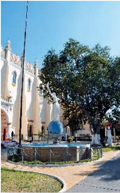
Antiguo Palacio Jai-Alai en Tijuana.

Ahora decide, junto con tu grupo, cuáles de la lista se pueden considerar patrimonio cultural y/o natural de la entidad.